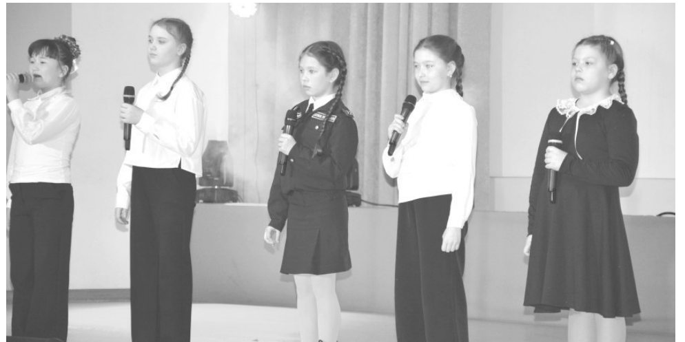
Вокальная группа «Подкова»

5 апреля в районном Доме культуры посёлка Солнечный царил атмосфера праздника и творчества. Здесь состоялся отчётный концерт «А музы не молчали» - одно из самых ярких и долгожданных культурных событий года в рамках смотра-конкурса «Земля талантами богата», посвящённый сразу трём важным датам: 80-летию Победы советского народа в Великой Отечественной войне, 80-й годовщине Дня Победы над милитаристской Японией и Году Защитника Отечества в Российской Федерации.