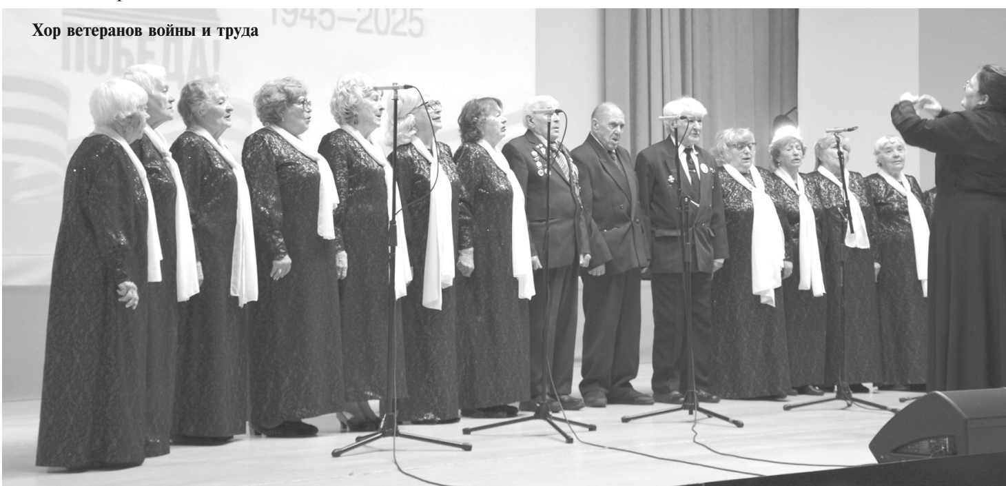
Хор ветеранов войны и труда