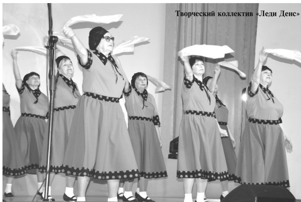
Творческий коллектив «Леди Денс»