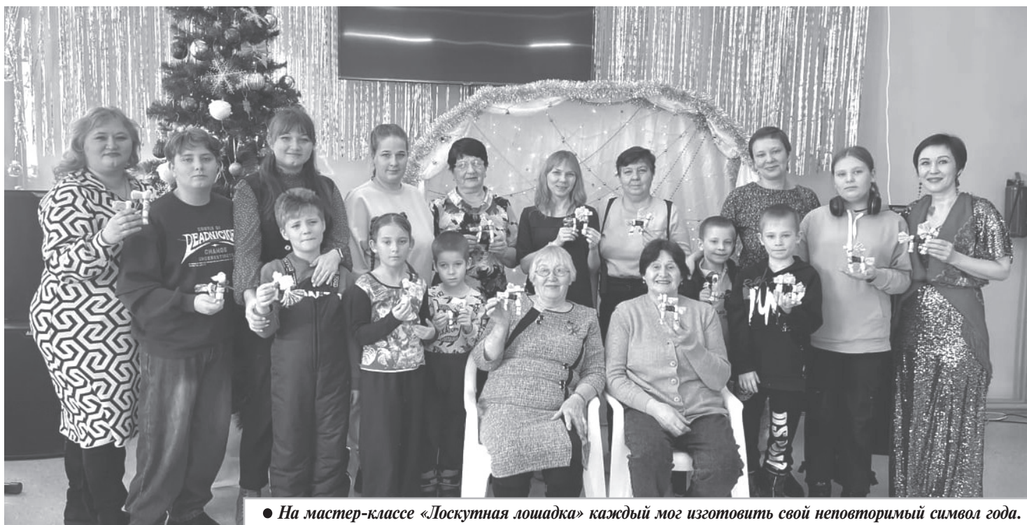
● На мастер-классе «Лоскутная лошадка» каждый мог изготовить свой неповторимый символ года.

После новогодних салютов и веселых дискотек, специалисты Дома культуры пригласили детвору на утренник. Здесь Дед Мороз с удовольствием выслушал все замечательно подготовленные для него стихи, а Снегурочка и Снеговик веселили ребят, играли с ними, пели песни и водили удалые хороводы.