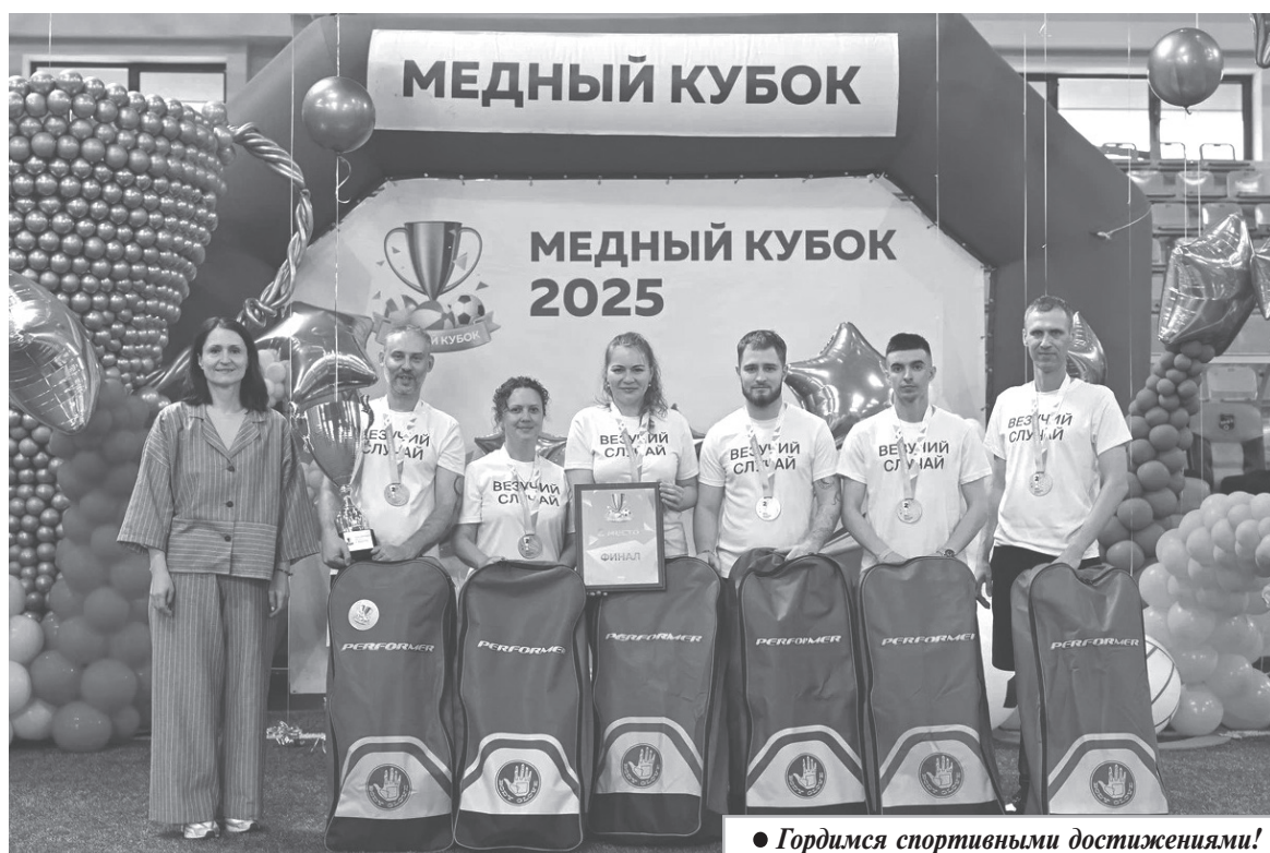
● Гордимся спортивными достижениями!