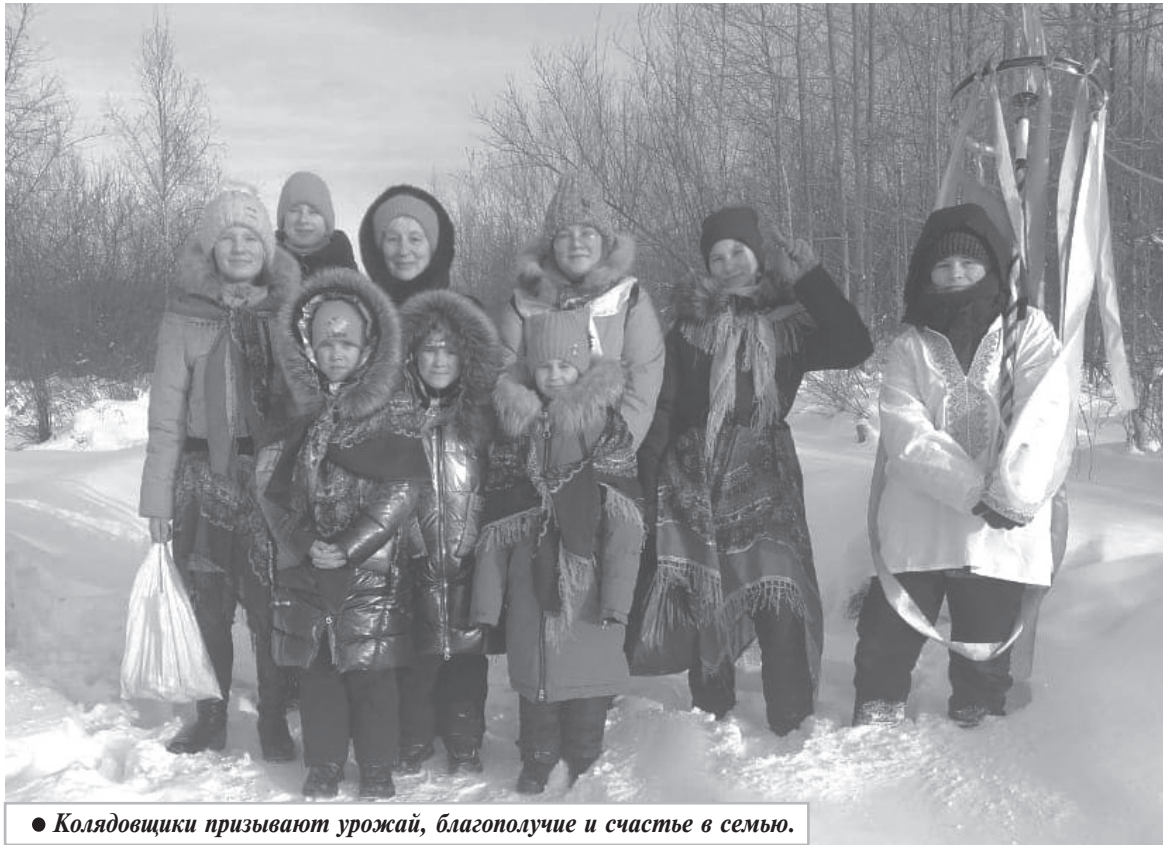
● Колядовщики призывают урожай, благополучие и счастье в семью.

Ежегодно, 6 января, когда морозный воздух звенит от предвкушения праздника, — вечер Рождественского Сочельника, улицы небольшого, но дружного поселка Гурское наполняются особым, звонким смехом и старинными песнями. В этот день здесь оживает одна из самых самобытных и любимых народных традиций — колядки. Главными героями этого зимнего чуда становятся, конечно же, дети.