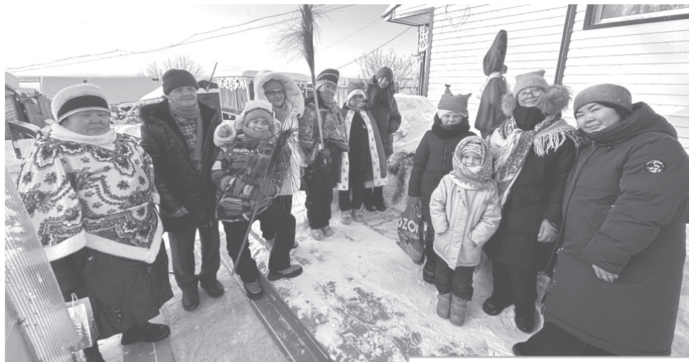
● С Рождественскими колядками в гости к односельчанам.

желающему. Весь вечер звучали композиции в разных стилях и жанрах. Каждый выбирал свои самые любимые песни и исполнял их от души.