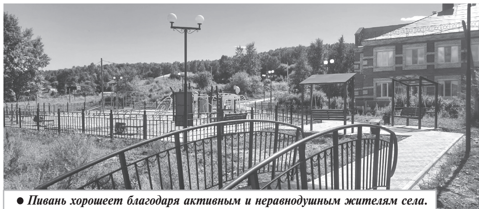
● Пивань хорошеет благодаря активным и неравнодушным жителям села.

Кроме того, в рамках данного проекта выполнены работы по устройству пешеходных дорожек из брусчатки, пешеходного мостика, установлено ограждение, а игровая зона теперь имеет песчаное покрытие. Также здесь установлено спортивное оборудование, такое как: мостик подвижный, лаз, подвесной гамак и велопарковка. Проводить время на площадке стало приятнее, благодаря установке комфортных скамеек и качелей с крышами и, безусловно, необходимых урн.