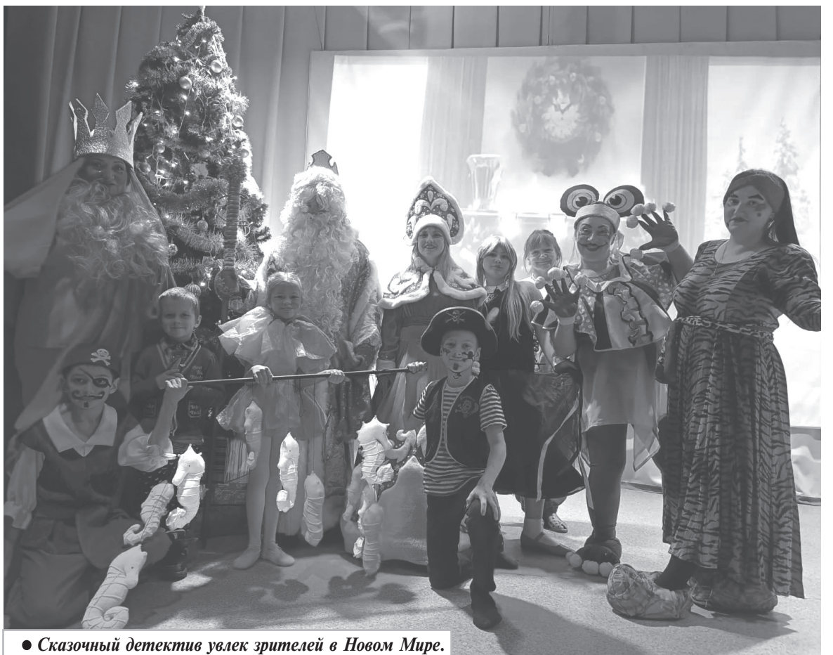
● Сказочный детектив увлек зрителей в Новом Мире.

Яркое торжество продолжилось около елки, сверкающей разноцветными огнями, с хороводом, песнями и плясками. Дети и взрослые были в восторге. А еще ребята порадовали Деда Мороза и Снегурочку, рассказав множество стихотворений про Новый год.