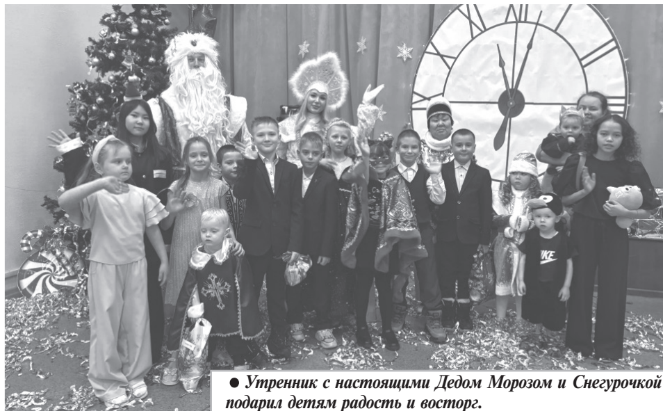
● Утренник с настоящими Дедом Морозом и Снегурочкой подарил детям радость и восторг.

3 января специалисты ДК пригласили на караоке-вечер «Поем душой». Чтобы петь, не обязательно обладать совершенными вокальными данными и быть профессионалом. Песни караоке — развлечение, которое носит легкий, ни к чему не обязывающий характер. И доступно оно любому