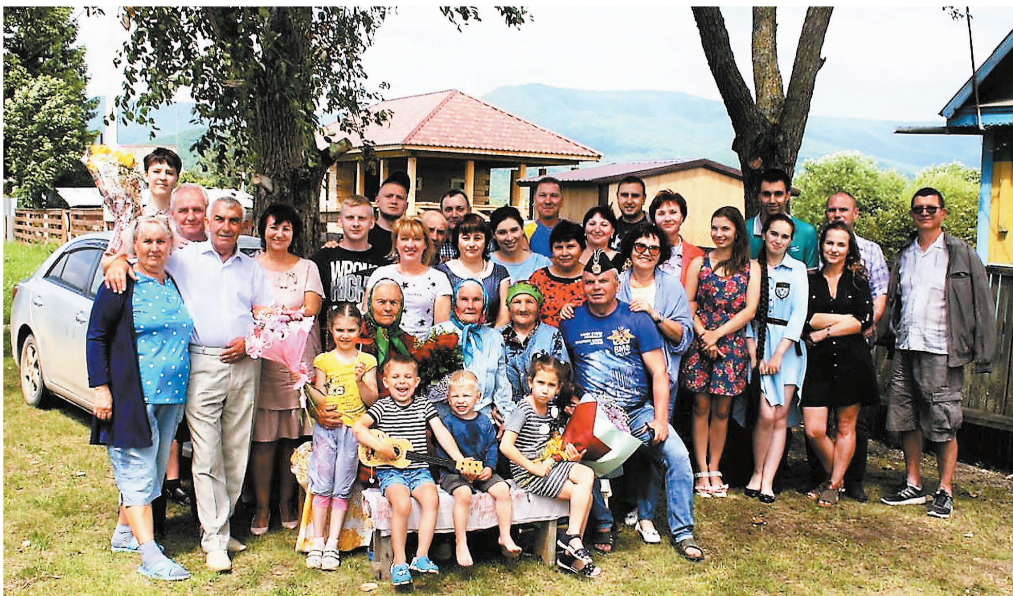
Фамилия у нас короткая, а вот семья многочисленная