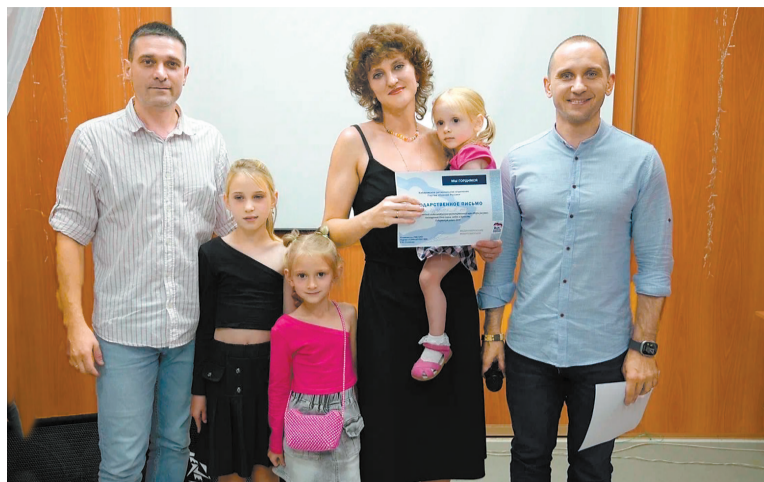
Семейный праздник в с. Краснореченском