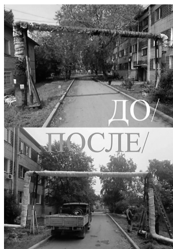
Изоляция тепловых сетей в с. Мирное

Вместе с тем, в рамках концессии продолжается реконструкция внутриквартальных участков тепловых сетей в сёлах Бычиха и Кузан, стро-