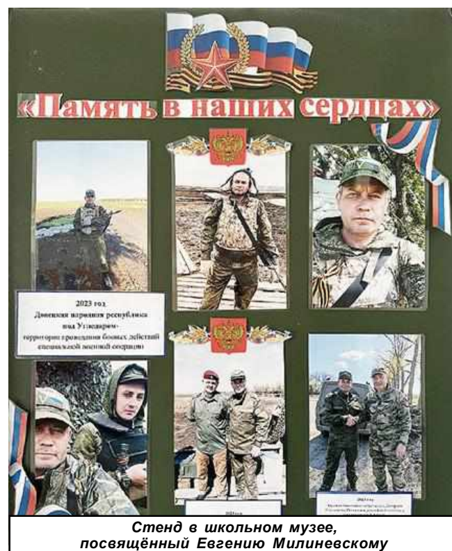
Стенд в школьном музее, посвящённый Евгению Милиневскому

"Парта Героя", на которой размещена фотография героя, информация о его жизни и подвиге, будет