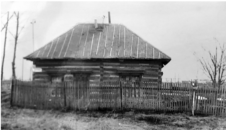
Дом на улице Партизанской, бывший штаб партизанского отряда