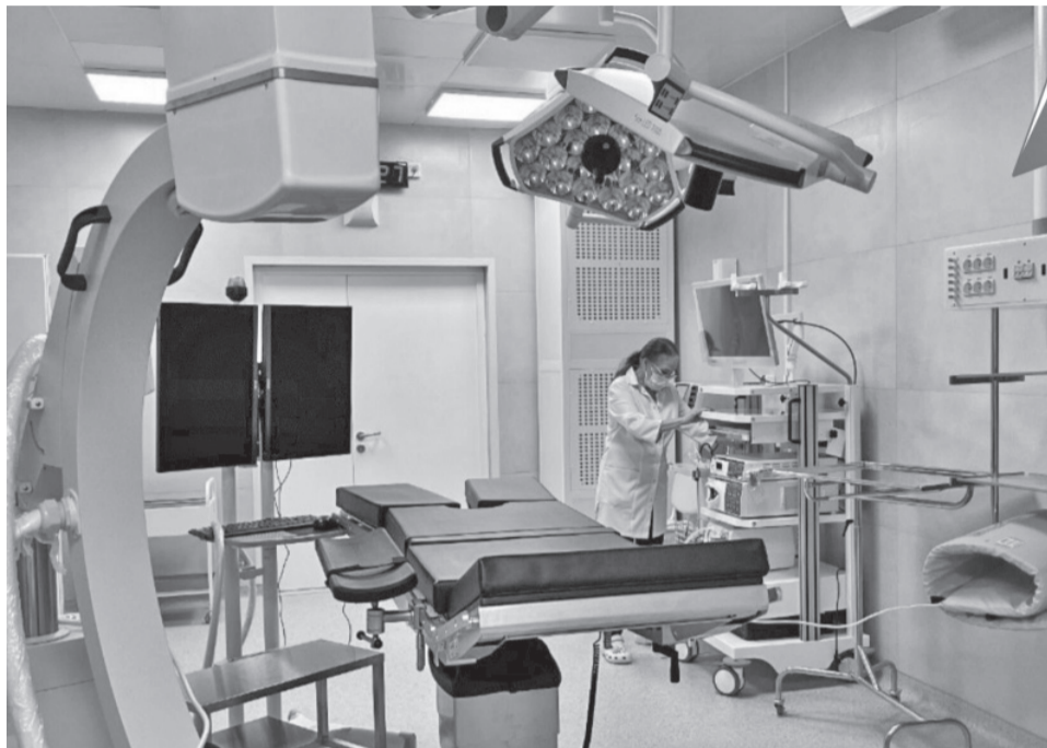
Фото противотуберкулёзный диспансер Миздрев Хабаровского края

В Хабаровском государственном медицинском колледже имени Макарова проходит распределение выпускников. Будущие специалисты выбирают вакансии для дальнейшего трудоустройства.