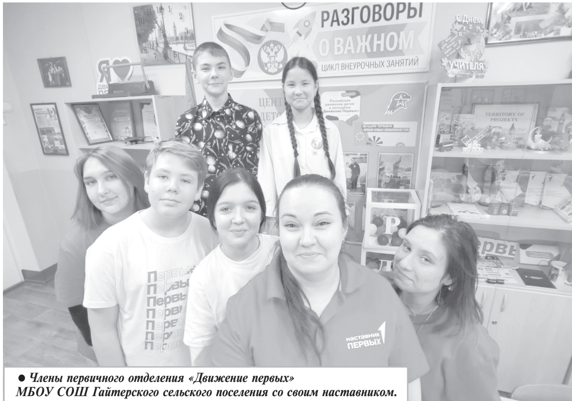
● Члены первичного отделения «Движение первых» МБОУ СОШ Гайтерского сельского поселения со своим наставником.

А финальный результат стал лишь подтверждением того, что при желании и совместных усилиях можно добиться невероятных результатов. «Лучшая команда» — это не просто название конкурса, это символ единства, олицетворяющий новую волну энергии и идей в нашем обществе.