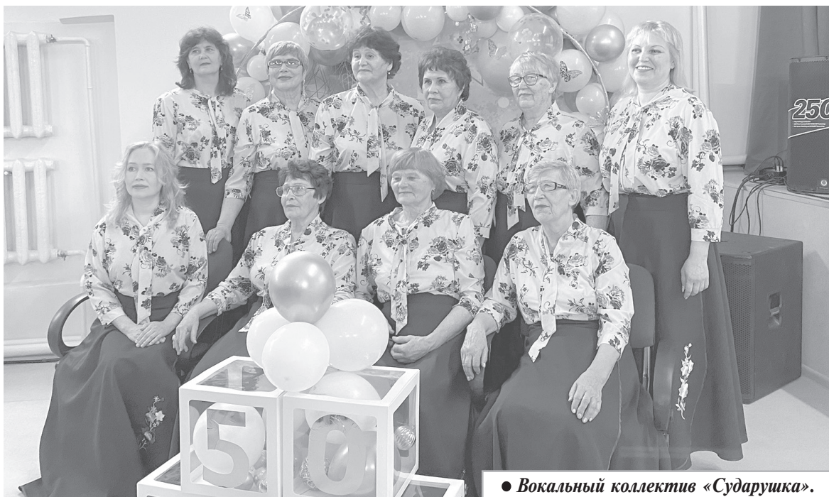
● Вокальный коллектив «Сударушка».