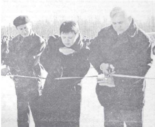
Сдан участок дороги «Ванино - Лидога»