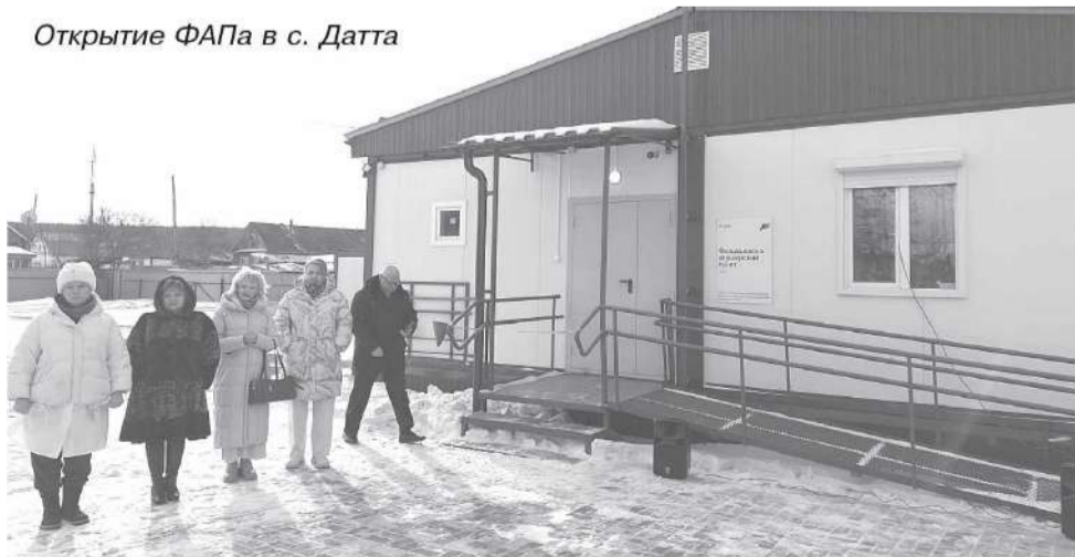
Открытие ФАПа в с. Датта

По материалам Телеграм-канала А. МАСЛОВА.