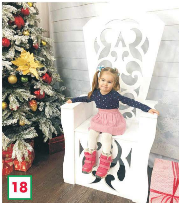
Номинация «Сам себе фотограф». Фото: «В ожидании нового года».