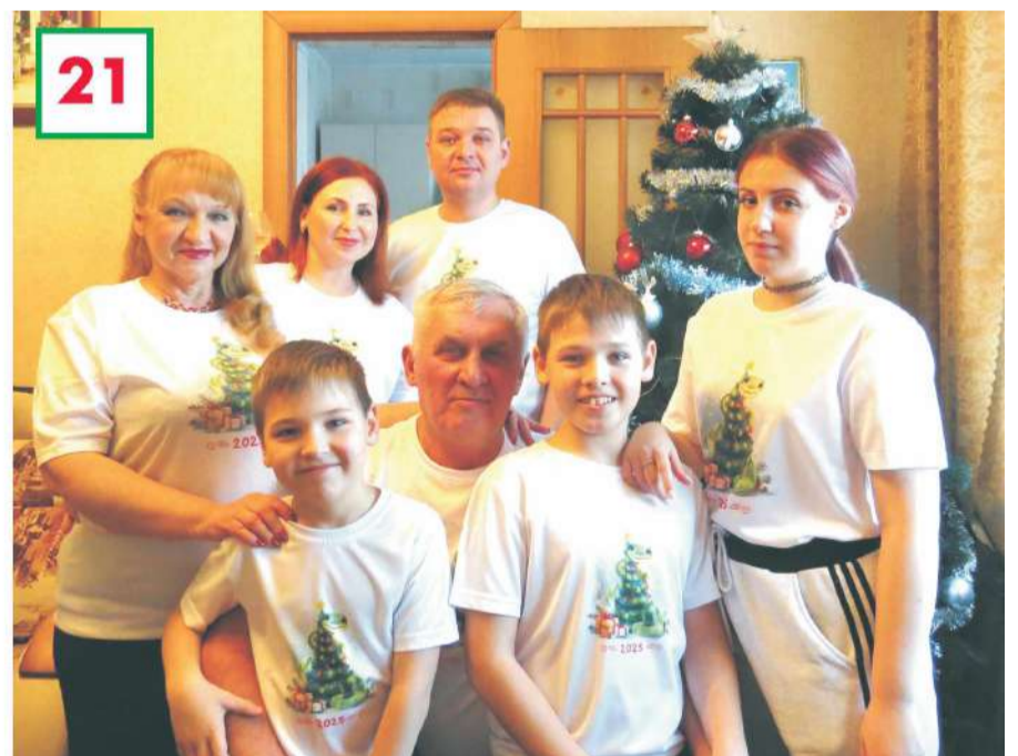
Номинация «Сам себе фотограф».