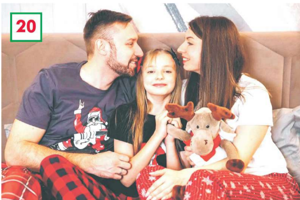
Номинация «Сам себе фотограф».