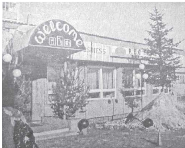
Ресторан «Бизнес-центр» по 1 Линии, 2