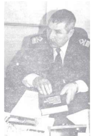
В. С. Качалов

Самым торжественным и значимым итогом 2002 года стало празднование 29-летия со дня образования Ванинского района. На торжестве подводили итоги: район занимал третье место в крае по объёму промышленного производства, работали лесные предприятия, а Ванинский порт оставался ключевым