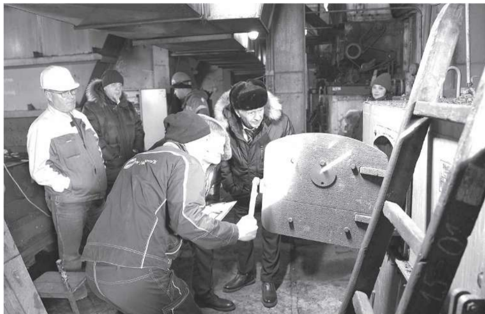
На запуске нового котла на котельной в п. Октябрьском

Долгожданный объект построен в рамках реализации программы модернизации первичного звена здравоохранения,