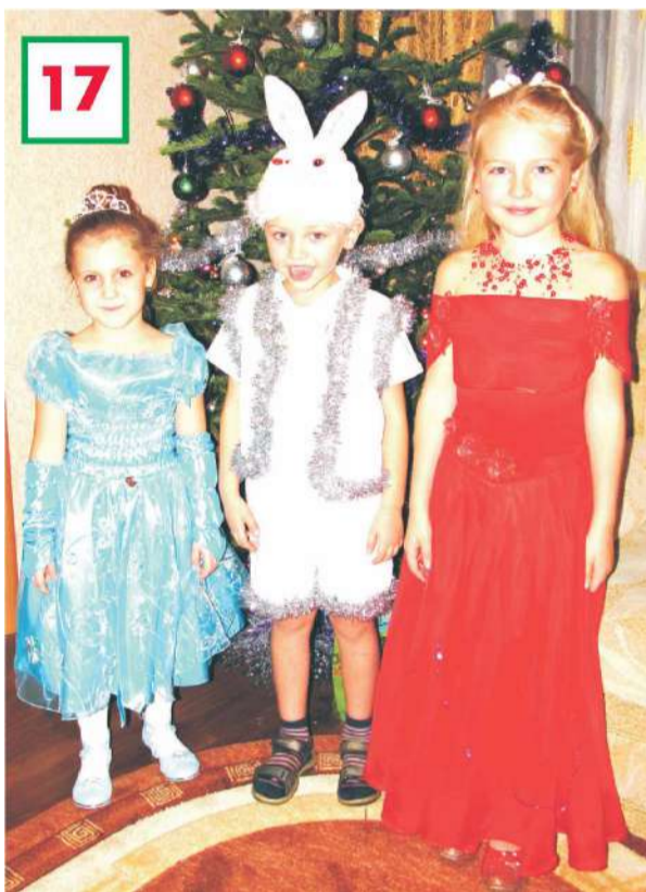
Номинация «Сам себе фотограф». Фото: «Зайки. Фото 2011 года».