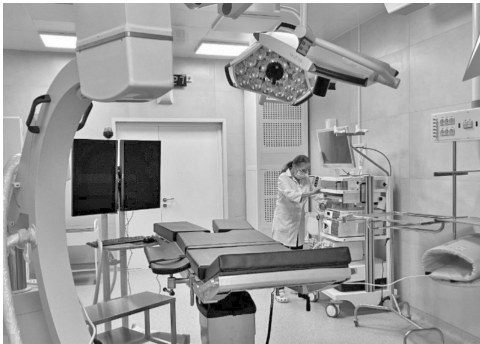
Фото: противотуберкулезный диспансер Мишнев Хабаровского края

В Хабаровском государственном медицинском колледже имени Макарова проходит распределение выпускников. Будущие специалисты выбирают вакансии для дальнейшего трудоустройства.