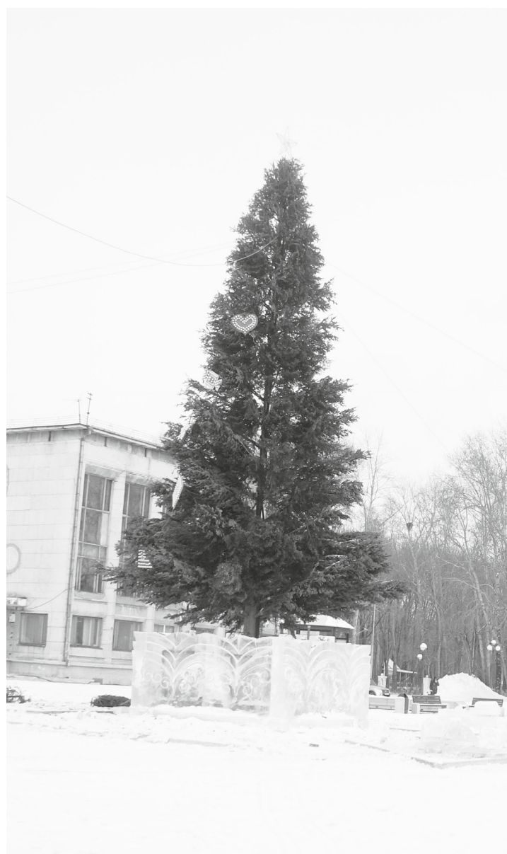
Раньше на площади Юности устанавливали главную городскую ёлку. Спустя несколько лет символ праздника сюда вернулся