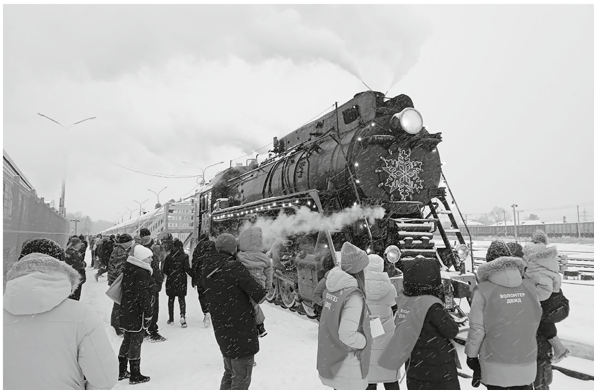
Поезд прибыл точно по расписанию, издали возвестив о себе паровозным гудком

В этом году поезд отправился в путь длиной почти 30 тысяч километров 19 ноября. Конечной точкой станет постоянная резиденция русского Деда Мороза в Великом Устюге, куда тот доберётся лишь 11 января. Жителям Екатеринбурга особенно повезло: к ним волшебный-железнодорожный состав нагрянет под самый Новый год, 31 декабря. В городе Юности же он пробыл до вечера и в тот же день ушёл на Сахалин. Следующая остановка по плану была в городе Невельске 30 ноября.