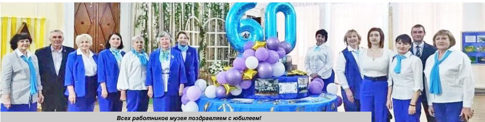
Всех работников музея поздравляем с юбилеем!