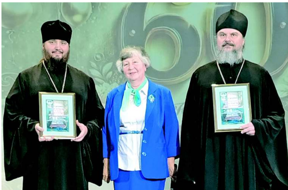
Районный краеведческий музей имени Н.К. Бошняка и Ванинская и Переяславская епархия - давние соратники в деле просвещения

Окончание читайте на стр.4