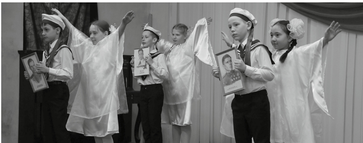
Номер из театрального фестиваля школы № 6

Развивается детский и юношеский образовательный туризм. В 50 учреждениях образования работают кружки туристско-краеведческой направленности, в которых занимаются 4167 детей. Реализуются 12 адаптированных программ для детей с ограниченными возможностями здоровья, которыми охвачено 112 детей с особыми потребностями.