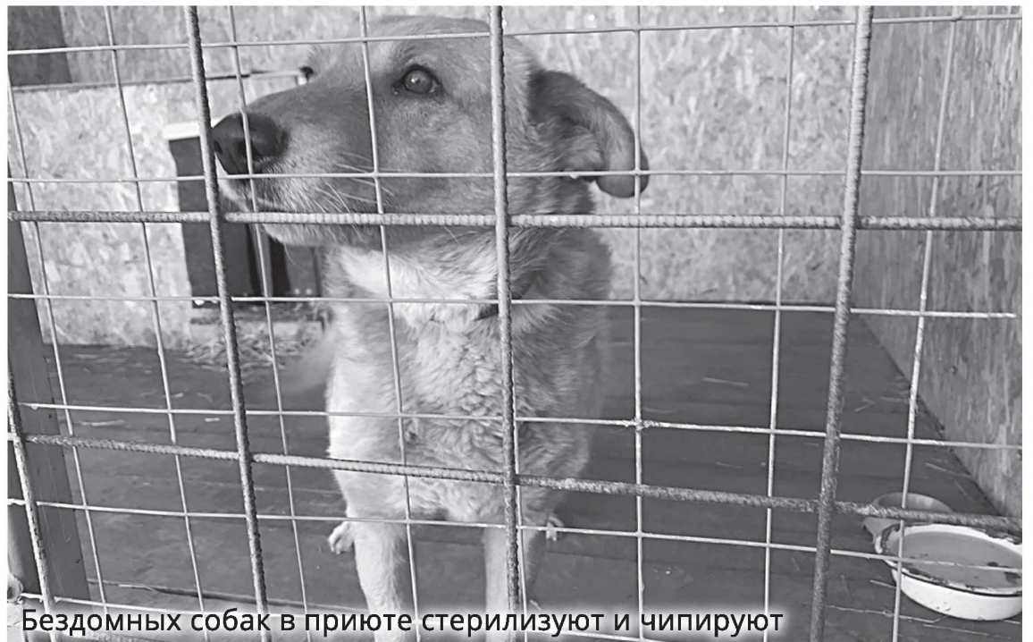
Бездомных собак в приюте стерилизуют и чипируют

Чтобы продолжать работу по отлову безнадзорных животных в этом году, администрация района обратилась к губернатору края с просьбой о выделении дополнительной субвенции на исполнение полномочий. Также на отлов бездомных животных у нас планируют направить средства, сэкономленные при проведении аук-