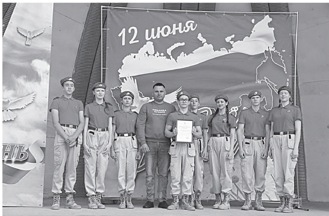
Патриотами не рождаются, ими становятся!

– Работа должна начаться уже сейчас. Но сейчас важным будет не только проведение массовых мероприятий, но и историческое просвещение населения. Например, работа волонтеров с ветеранским сообществом и с архивной базой в рамках проекта «Связь поколений» – запущен Всероссийский проект «Моя история» по сбору материалов об истории своей семьи. Еще один проект «Наша Победа» – про то, что мы гордимся не только нашим прошлым, но и нашим настоящим. Здесь мы будем про-