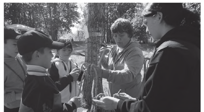
Узлы вяжет команда Арутюнян.