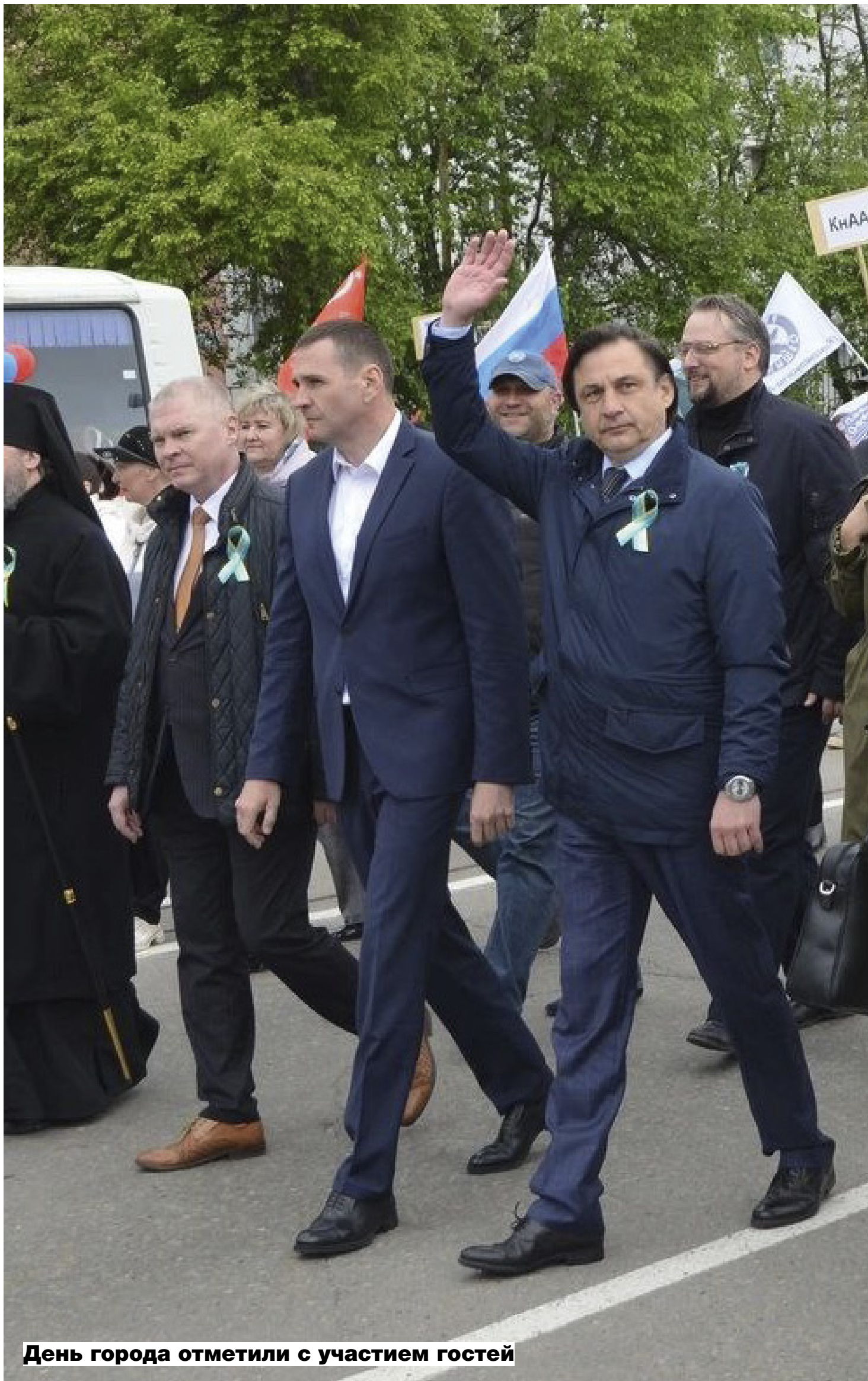
День города отметили с участием гостей