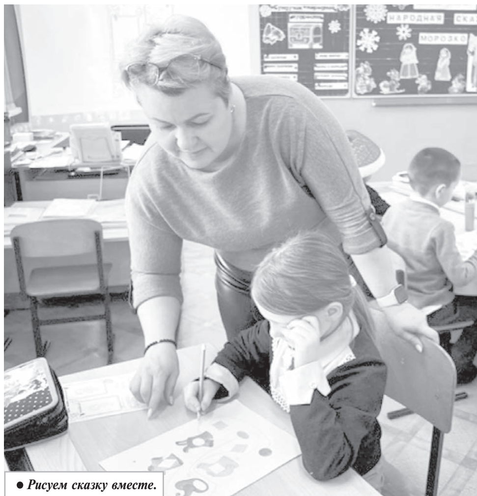
● Рисуем сказку вместе.