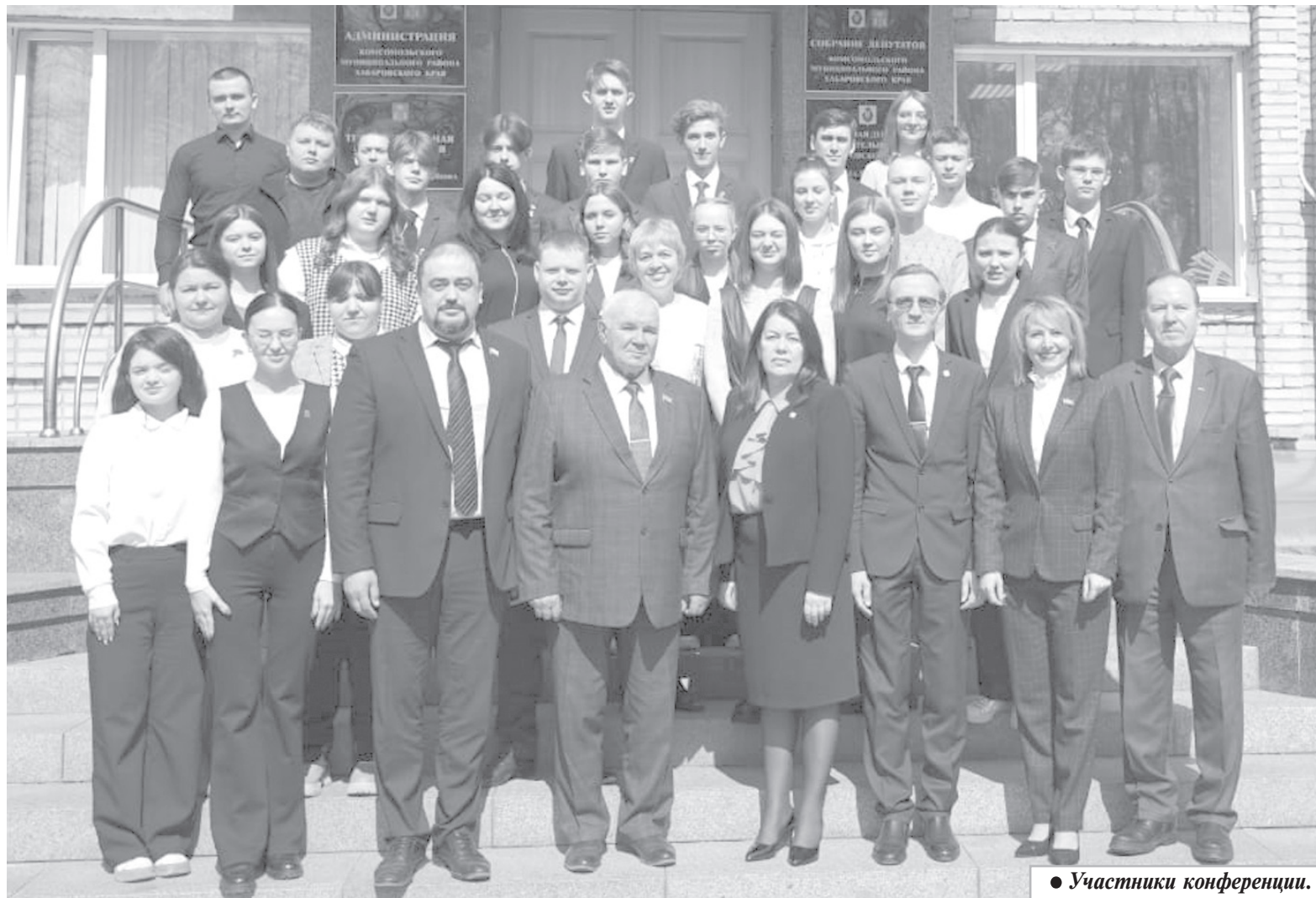
● Участники конференции.