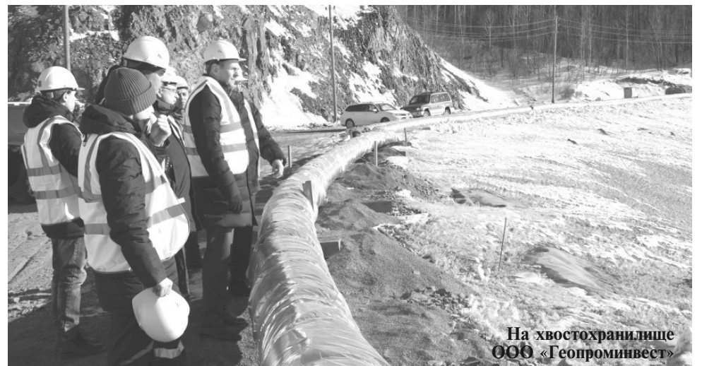
На хвостохранилище ООО «Геопроминвест»

На территории Солнечного района с 2020 года ООО «Геопроминвест» реализует инвестиционный проект «Строительство горно-обогатительной фабрики по переработке запасов техногенного месторождения» в качестве резидента территории опережающего развития «Хабаровск».