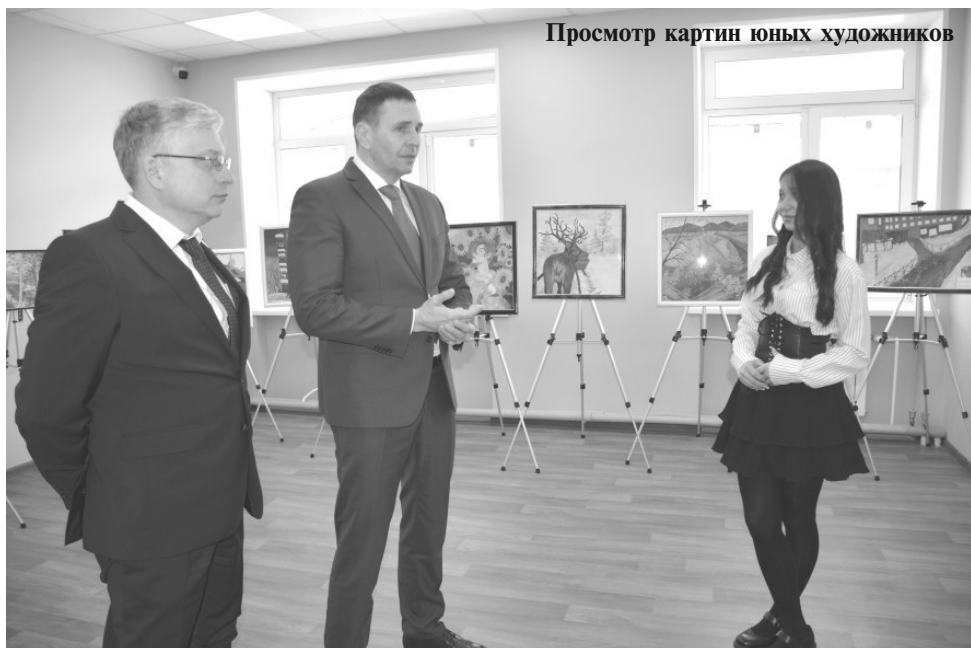
Просмотр картин юных художников