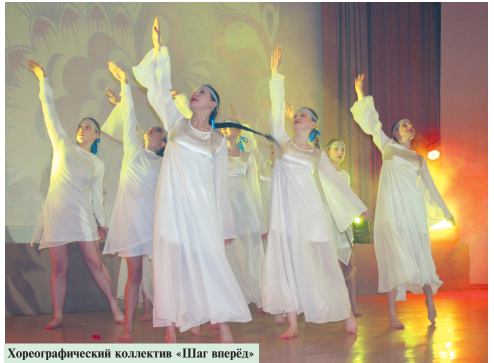
Хореографический коллектив «Шаг вперёд»