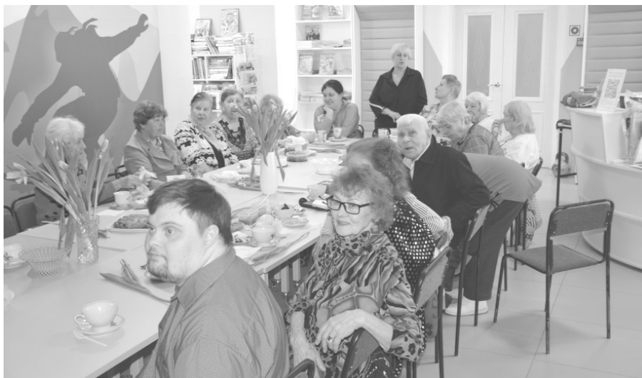
За дружеским столом