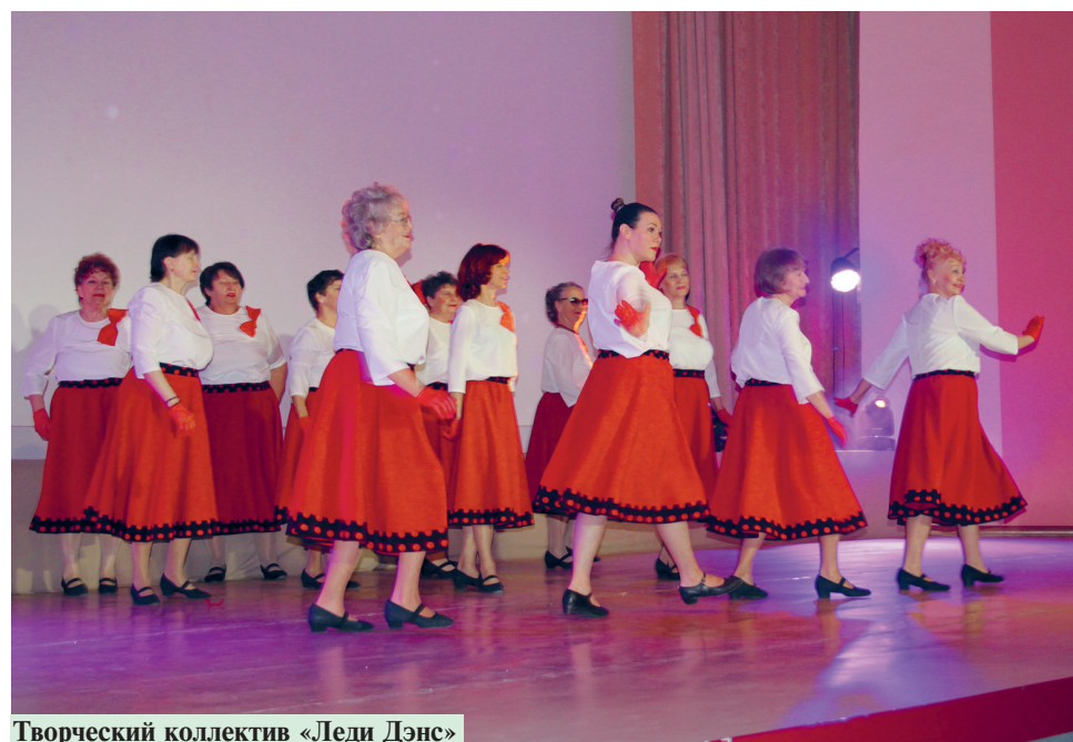
Творческий коллектив «Леди Дэнс»