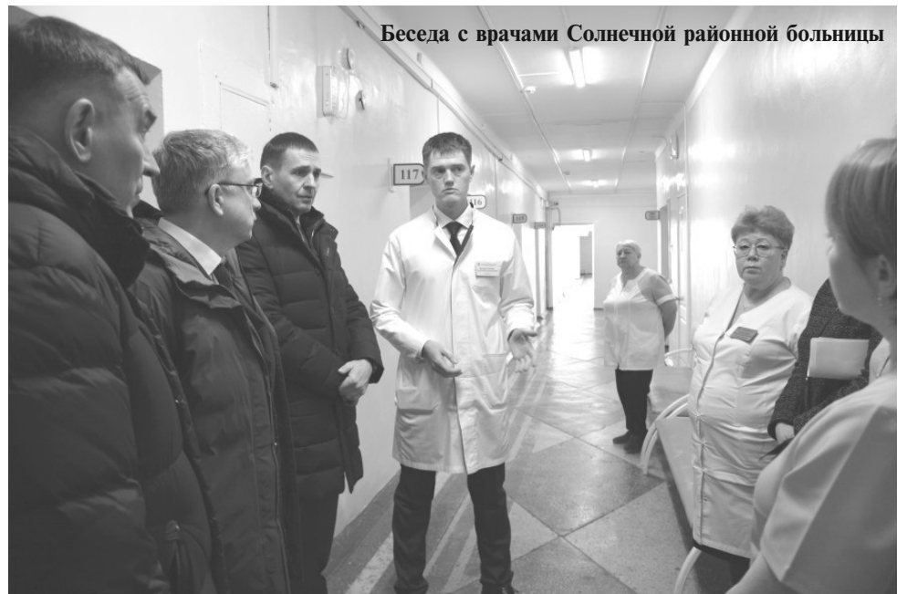
Беседа с врачами Солнечной районной больницы

Также губернатор посетил Солнечную районную больницу и пообщался с врачами, которые приехали работать в район благодаря программе «Земский доктор» и целевому обучению. Больница полностью укомплектована терапевтами и педиатрами. За свой счёт учреждение обучает врача-невролога. На очереди — подготовка лор-врача. В сто-