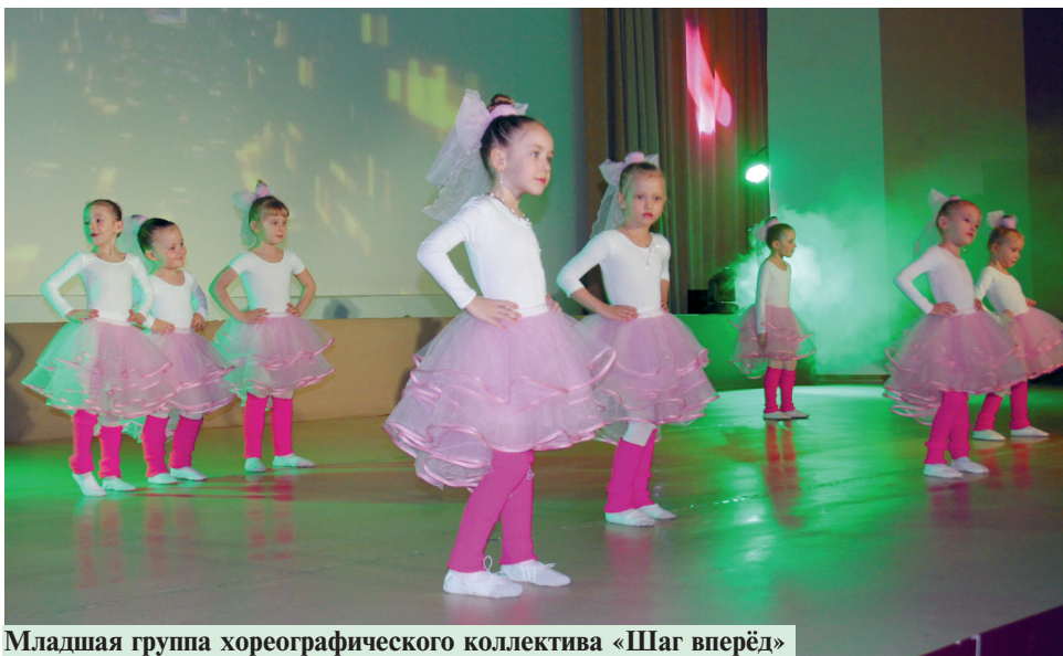
Младшая группа хореографического коллектива «Шаг вперёд»