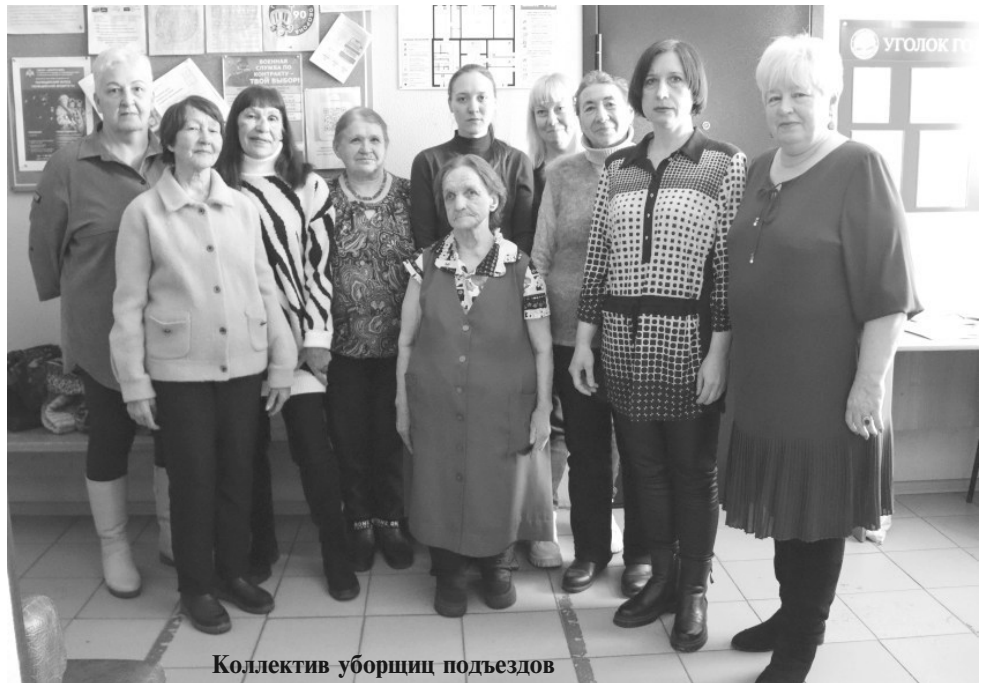
Коллектив уборщиц подъездов

- Специалистам жилищно-коммунального хозяйства необходимо быть в постоянной готовности, чтобы выехать на ликвида-