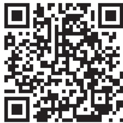
Фоторепортаж с праздника Масленицы

Женщина смеётся и подмигивает: «Всё по ГОСТу, как положено». Тор-