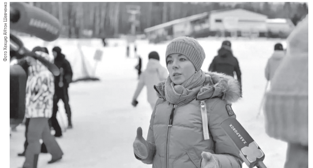
Фото Хехцир АНГон Швецено

По его словам, проект будет реализован с участием как государственных, так и частных средств.