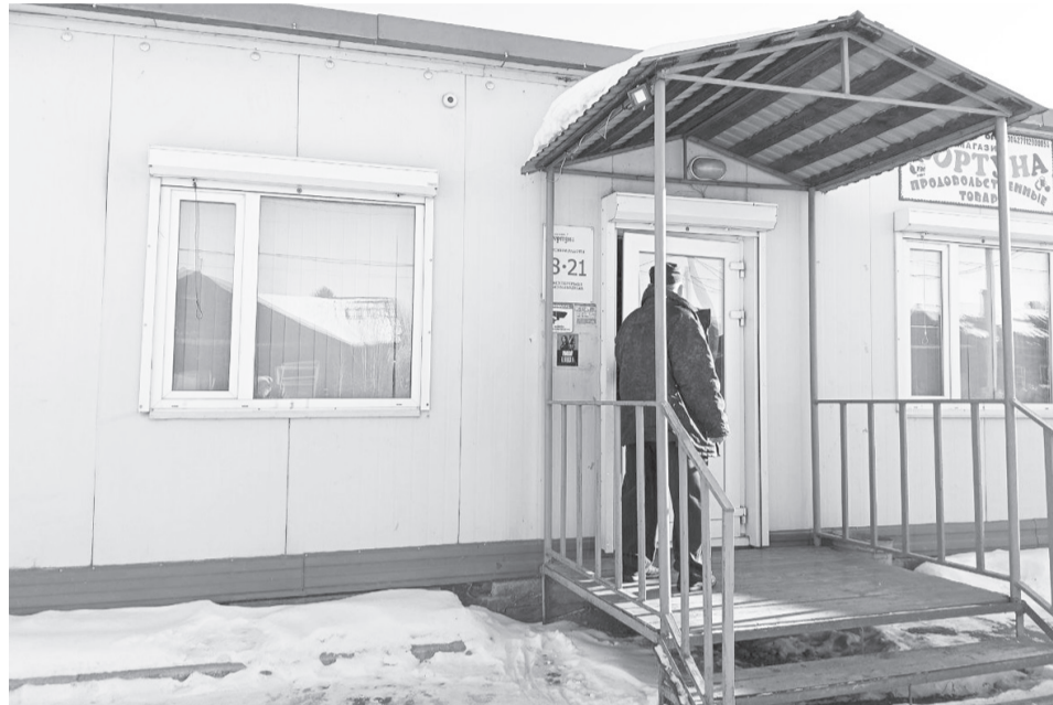
Уютные маленькие магазины в городских микрорайонах пока остаются притягательными для многих покупателей