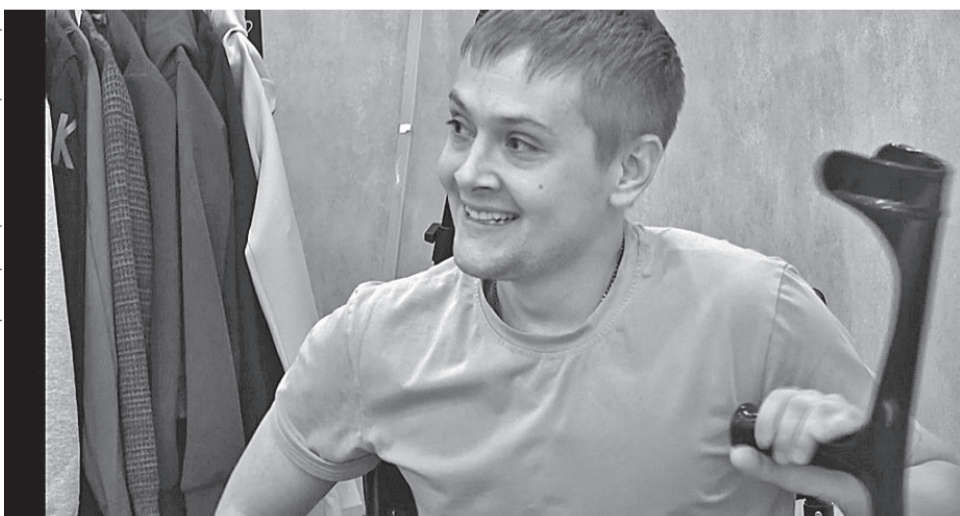
Фото СВО пресс-служба правительства Хабаровского края

Программа была насыщенной и плодотворной, многие проблемы удалось решить сразу.