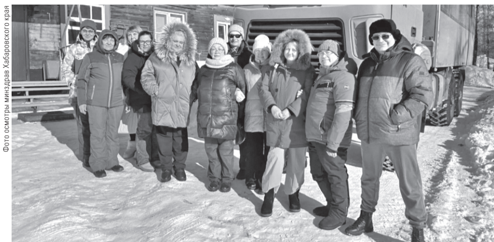
Фото осмотра минздрава Хабаровского края

Напомним, стать участниками международных выставок, а также других мероприятий, направленных на продвижение продукции за рубеж, могут малые и средние компании края. Для получения поддержки нужно обратиться в краевой Центр экспорта по телефонам: +7 (4212) 35-84-45, 77-01-22, а также по адресу: г. Хабаровск, ул. Истомина, 51А, каб. 705.