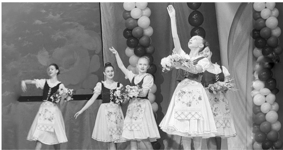
Танец «Вьюн» в исполнении ансамбля танца «Потешки»

Под таким названием в районном Доме культуры «Радуга» состоялся праздничный концерт.