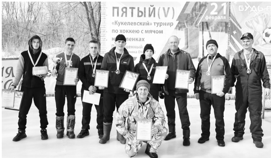
Победители кукелевского турнира

В селе Кукелево в пятый раз состоялся традиционный турнир по хоккею с мячом на валенках, посвящённый Дню защитников Отечества.