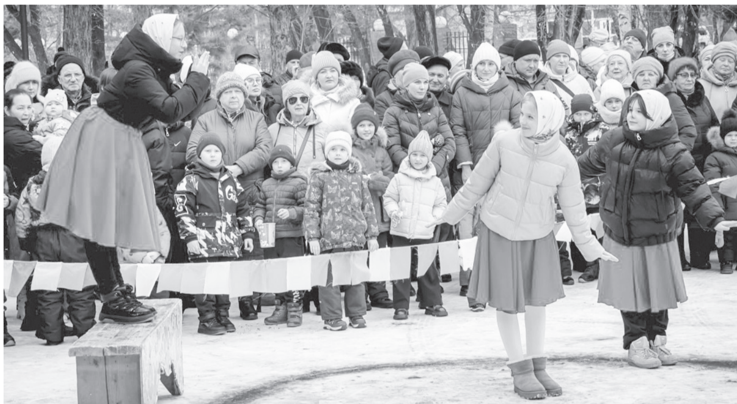
Смех детей, горячие блины и песни — так Вяземский провожал зиму

Корреспондент «Вяземских вестей» прогулялся по ярмарочным рядам праздника масленицы и узнал истории тех, кто делает наши праздники по-настоящему душевными и вкусными.