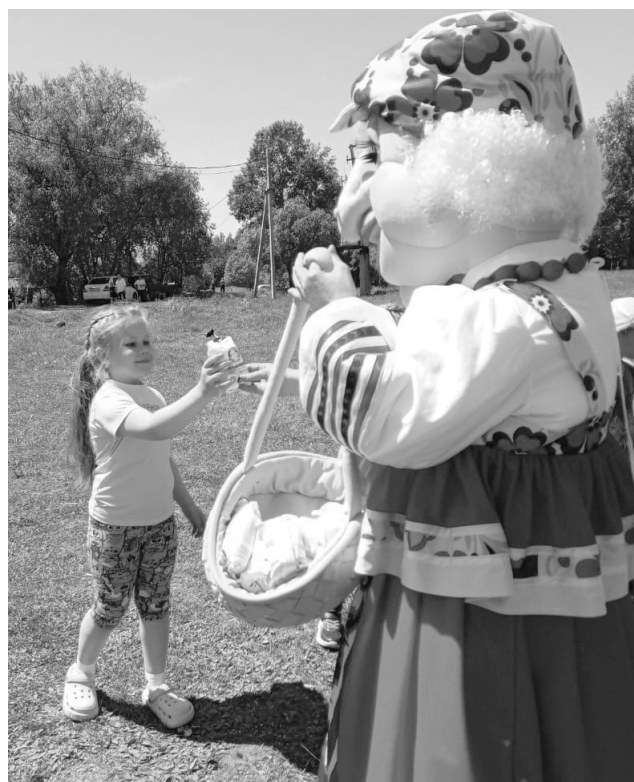
Жители сельского поселения «Село Добролюбово» Бикинского муниципального района Хабаровского края

и гости села 1 июня 2024г. завершили реализацию проекта «Мир детства» ТОС «Возрождение» и провели веселый праздник.