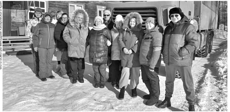
Фото осмотра министра здравоохранения Хабаровского края

Напомним, стать участниками международных выставок, а также других мероприятий, направленных на продвижение продукции за рубеж, могут малые и средние компании края. Для получения поддержки нужно обратиться в краевой Центр экспорта по телефонам: +7 (4212) 35-84-45, 77-01-22, а также по адресу: г. Хабаровск, ул. Истомина, 51А, каб. 705.