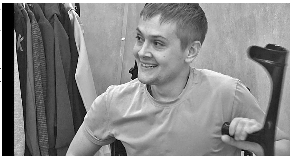
Фото СВО пресс-служба правительства Хабаровского края

Программа была насыщенной и плодотворной, многие проблемы удалось решить сразу.