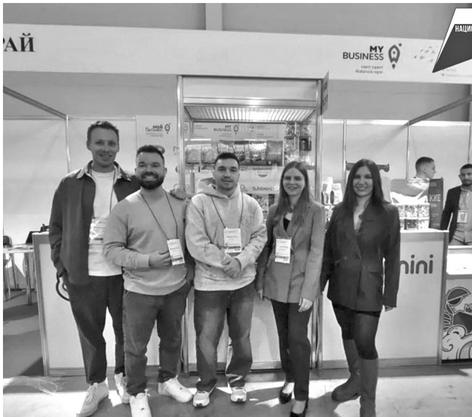
Фото выставки министерства экономического развития Хабаровского края

Предприятия края выступили на коллективном стенде при содействии краевого Центра поддержки экспорта в рамках нацпроекта «Международная кооперация и экспорт». Такая мера поддержки для малого и среднего бизнеса положительно сказывается на развитии деловой активности, улучшает инвестиционный климат в регионе, открывая местные рынки для товаропроизводителей.