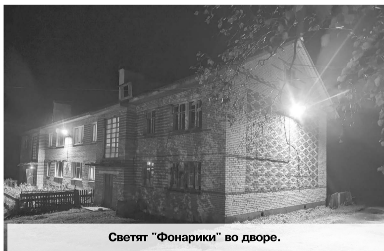
Светят "Фонарики" во дворе.