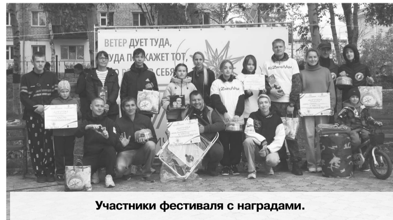
Участники фестиваля с наградами.