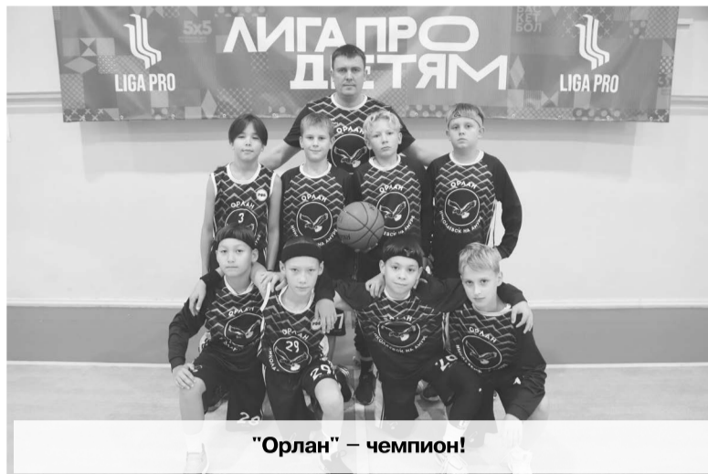
"Орлан" – чемпион!

Первую встречу турнира ребята проводили, что называется, сразу с трапа самолета, едва успев забросить сумки в комнаты хостела. Игра проходила в спортивной школе "Феникс" и завершилась в нашу пользу –