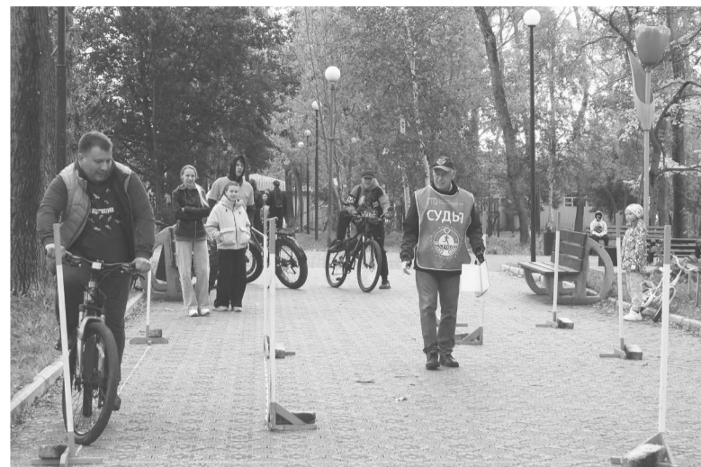
Конкурс по фигурному вождению велосипеда "Зигзаг удачи".

В преддверии Всемирного дня туризма в городском сквере прошёл туристический фестиваль «На семи ветрах». Пять семей соревновались за звание самой активной и сплоченной команды.