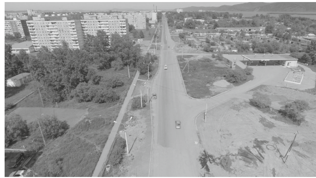
После окончания всех запланированных работ улица Дзержинского вновь вернёт себе статус въездных ворот в город

В 2024 году самообеспеченность региона яйцом составила 90%. В прошлом году в крае было произведено 337,7 миллиона штук яиц, что в 1,4 раза больше, чем годом ранее. Это стало возможно благодаря поддержке, которую предприятия получают из федерального и регионального бюджетов.