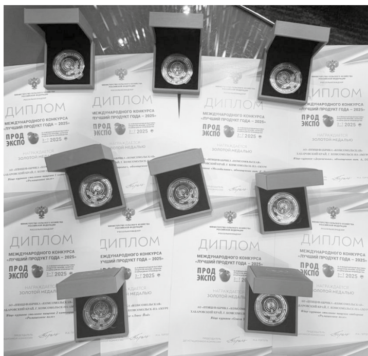
Наградами были отмечены куриные яйца разных категорий, а также обогащённые йодом, омега 3 и витаминами