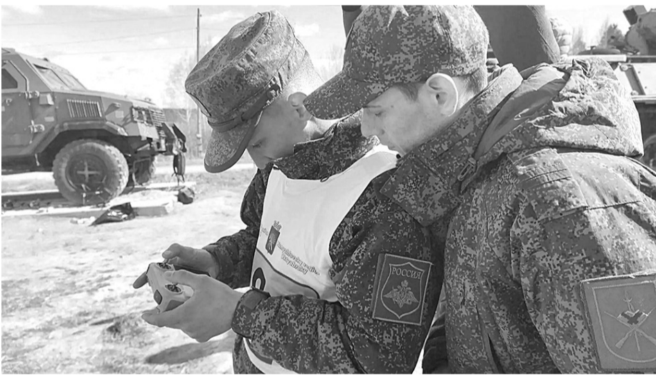
Пресс-служба Восточного военного округа.

Команда Восточного военного округа по итогам чемпионата поднялась на вторую ступень пьедестала среди военных округов, продемонстрировав слаженную работу расчетов и высокий уровень владения техникой. Мероприятия такого уровня активно способствуют подготовке профессиональных кадров для Войск беспилотных систем Вооруженных Сил Российской Федерации и позволяют совершенствовать методы применения разведывательных и ударных дронов в боевых условиях.