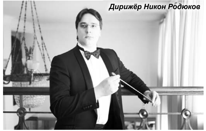
Дирижёр Никон Родюков

22 декабря 2018 года в 13.00 и 15.00 на сцене Районного дома культуры г. Бикина состоятся концерты Дальневосточного академического симфонического оркестра под управлением Никона Родюкова. Оркестр представит жителям г. Бикина праздничную программу и создаст прекрасное предновогоднее настроение!