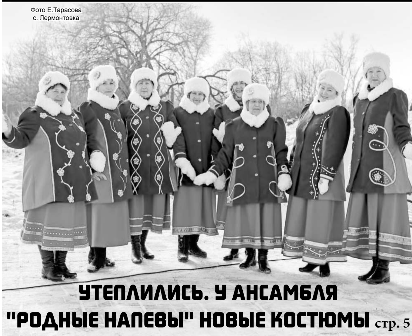
с. Лермонтовка