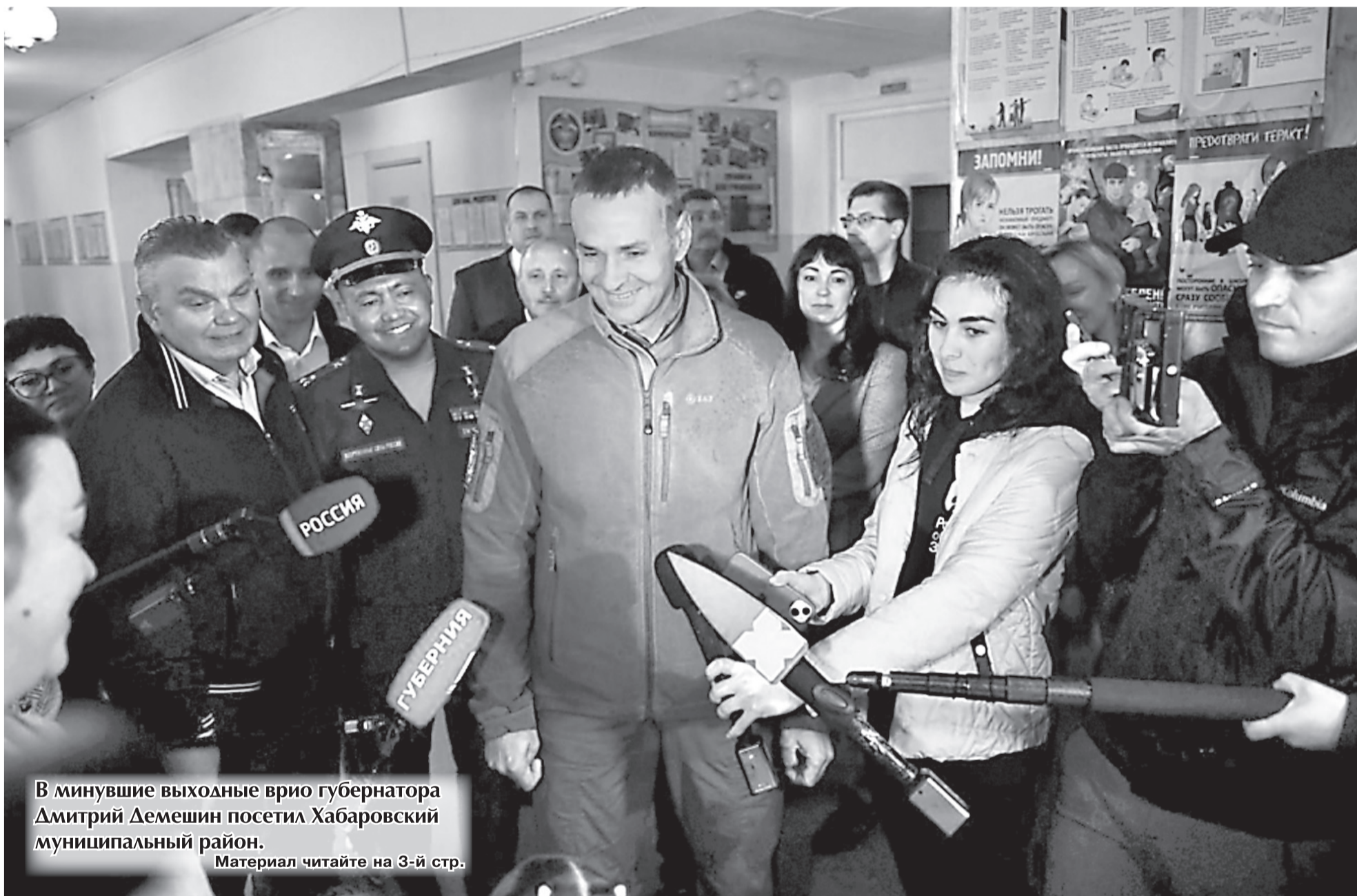
В минувшие выходные врио губернатора Дмитрий Демешин посетил Хабаровский муниципальный район. Материал читайте на 3-й стр.