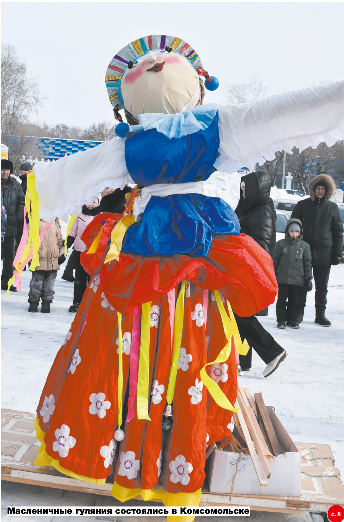
Масленичные гуляния состоялись в Комсомольске