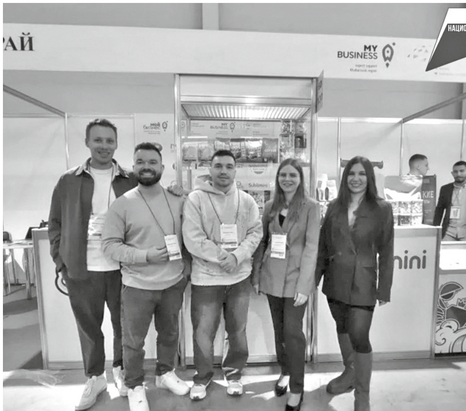
Фото выставка министерство экономического развития Хабаровского края

Предприятия края выступили на коллективном стенде при содействии краевого Центра поддержки экспорта в рамках нацпроекта «Международная кооперация и экспорт». Такая мера поддержки для малого и среднего бизнеса положительно сказывается на развитии деловой активности, улучшает инвестиционный климат в регионе, открывая местные рынки для товаропроизводителей.