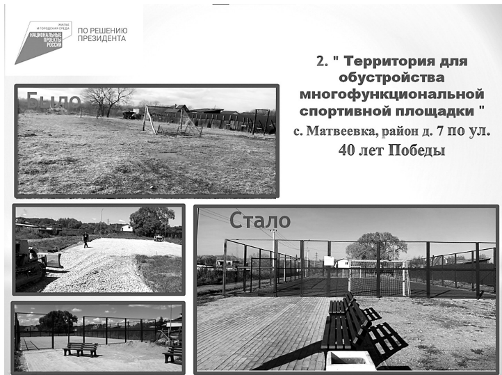
2. "Территория для обустройства многофункциональной спортивной площадки" с. Матвеевка, район д. 7 по ул. 40 лет Победы

МБУК «Межпоселенческая библиотека Хабаровского муниципального района Хабаровского края».