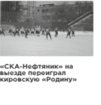
«СКА-Нефтяник» на выезде переиграл хабаровскую «Родину»