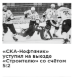
«СКА-Нефтяник» уступил на выезде «Строителю» со счётом 5:2