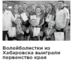
Волейболисты из Хабаровска выиграли первенство края