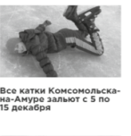
Все катки Комсомольска-на-Амуре льют с 5 по 15 декабря