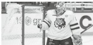
Победную серию ХК «Амур» прервал лидер регулярного чемпионата