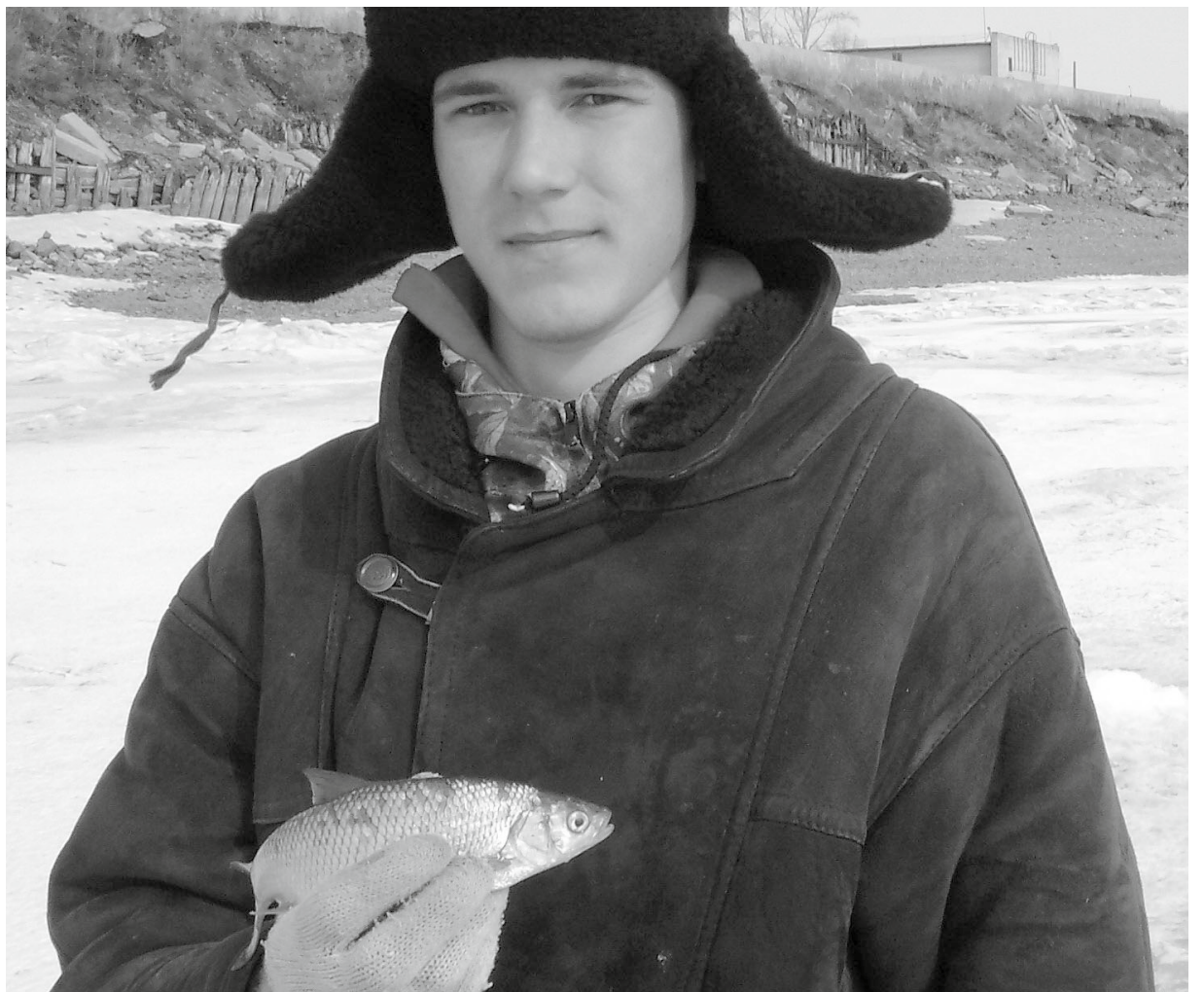
Этот молодой удильщик уже может по праву праздновать День зимнего рыбака

Впереди начало календарной весны! Будут новые надежды на успех!