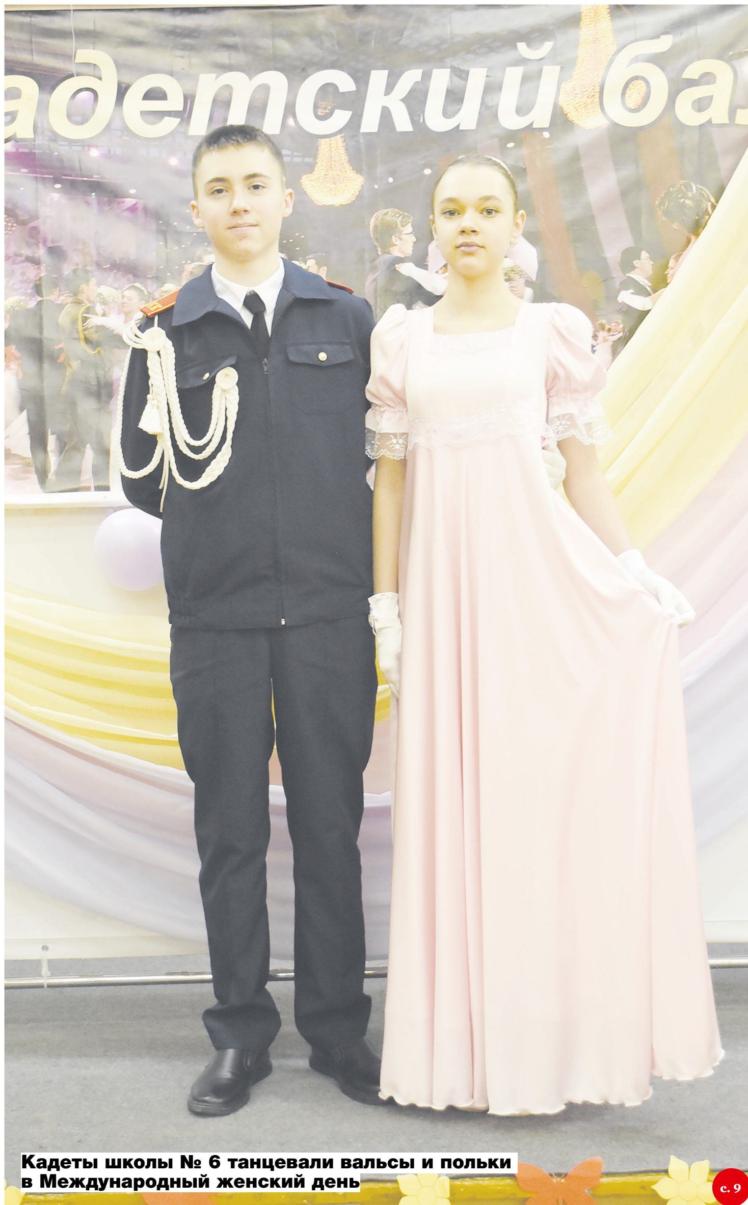
Кадеты школы № 6 танцевали вальсы и польки в Международный женский день