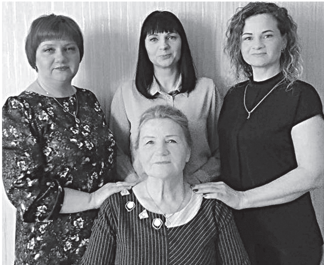
Династия педагогов Тишковых – мама и три дочери.

– Когда наступило время идти на пенсию, решила: хватит! Но предложили поработать психологом в школе-интернате № 9, и я согласилась. С детьми не чувствуешь своего возраста. Работа с ними – лучшее средство от старе-