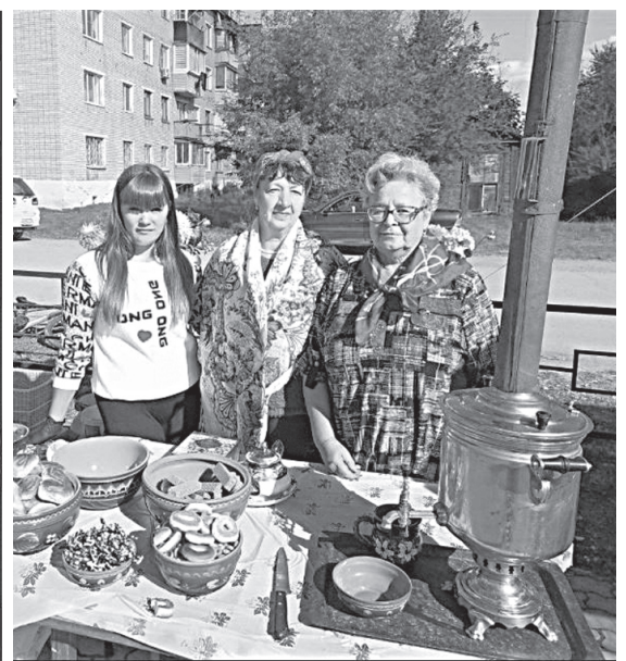
Хлебосольные хозяйки угощали на ярмарке чаем, домашней выпечкой.