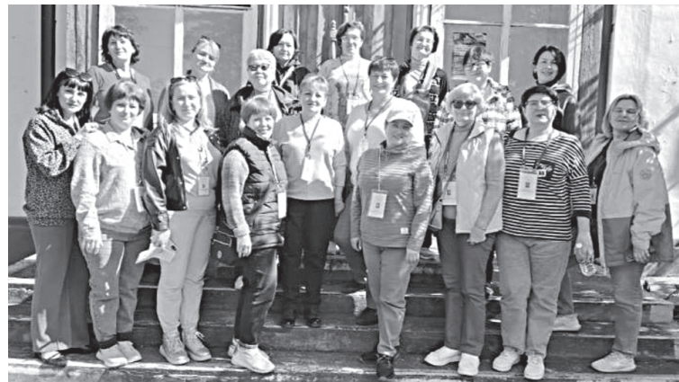
Бикинская экспедиция хорских учителей истории.