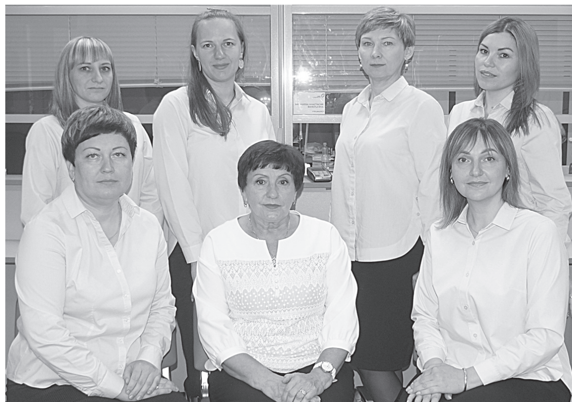
Поздравляем с юбилеем!

Наши специалисты, а также специалисты девяти ТОСП, то есть территориально обособленных структурных подразделений района, действующих в поселениях (в Бичевой, Георгиевке, Мухене, Кондратьевке, Марусино, в Полетном, Сите, Черняево и Хоре), готовы предоставить