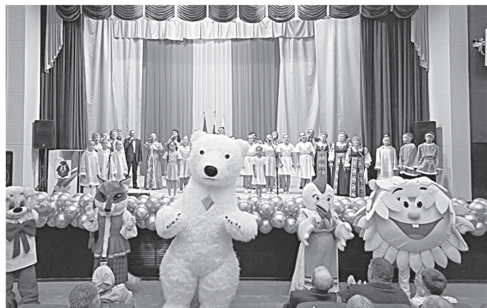
Главное торжество состоялось в зрительном зале.

Два дня шло празднование 70-летия нашего посёлка и 50-летия дома культуры.