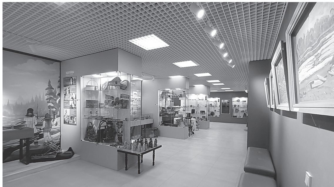
Обновленный районный музей ждёт гостей.

Особый момент: в музее скоро заработает подъемник, благодаря которому познакомиться с музейными экспозициями и побывать на его мероприятиях те-