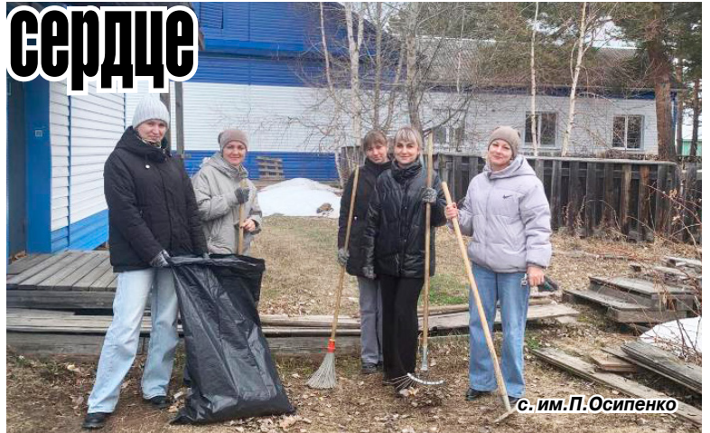
с. им. П. Осипенко

На состоявшемся 5 мая в Администрации района координационном совете были обсуждены вопросы подготовки и проведения праздника, посвященного 81-й годовщине Победы в Великой Отечественной войне. В День Победы пройдут торжественные акции, культурно-массовые, спортивные мероприятия. В селе им.П.Осипенко был организован субботник по очистке территорий возле памятников, учреждений,