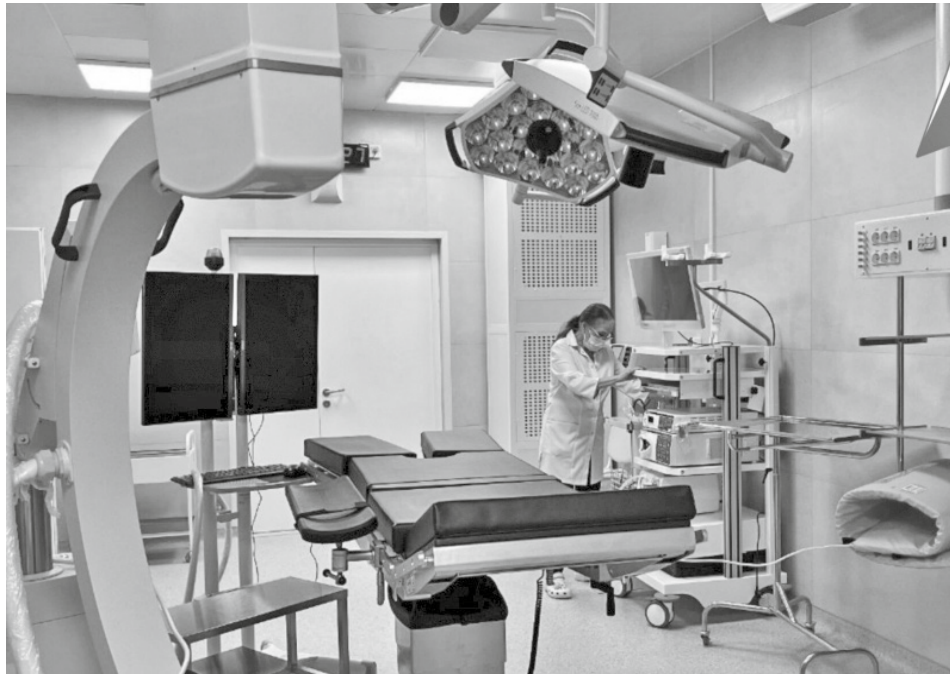
Фото: противотуберкулезный диспансер Минздрав Хабаровского края

В Хабаровском государственном медицинском колледже имени Макарова проходит распределение выпускников. Будущие специалисты выбирают вакансии для дальнейшего трудоустройства.