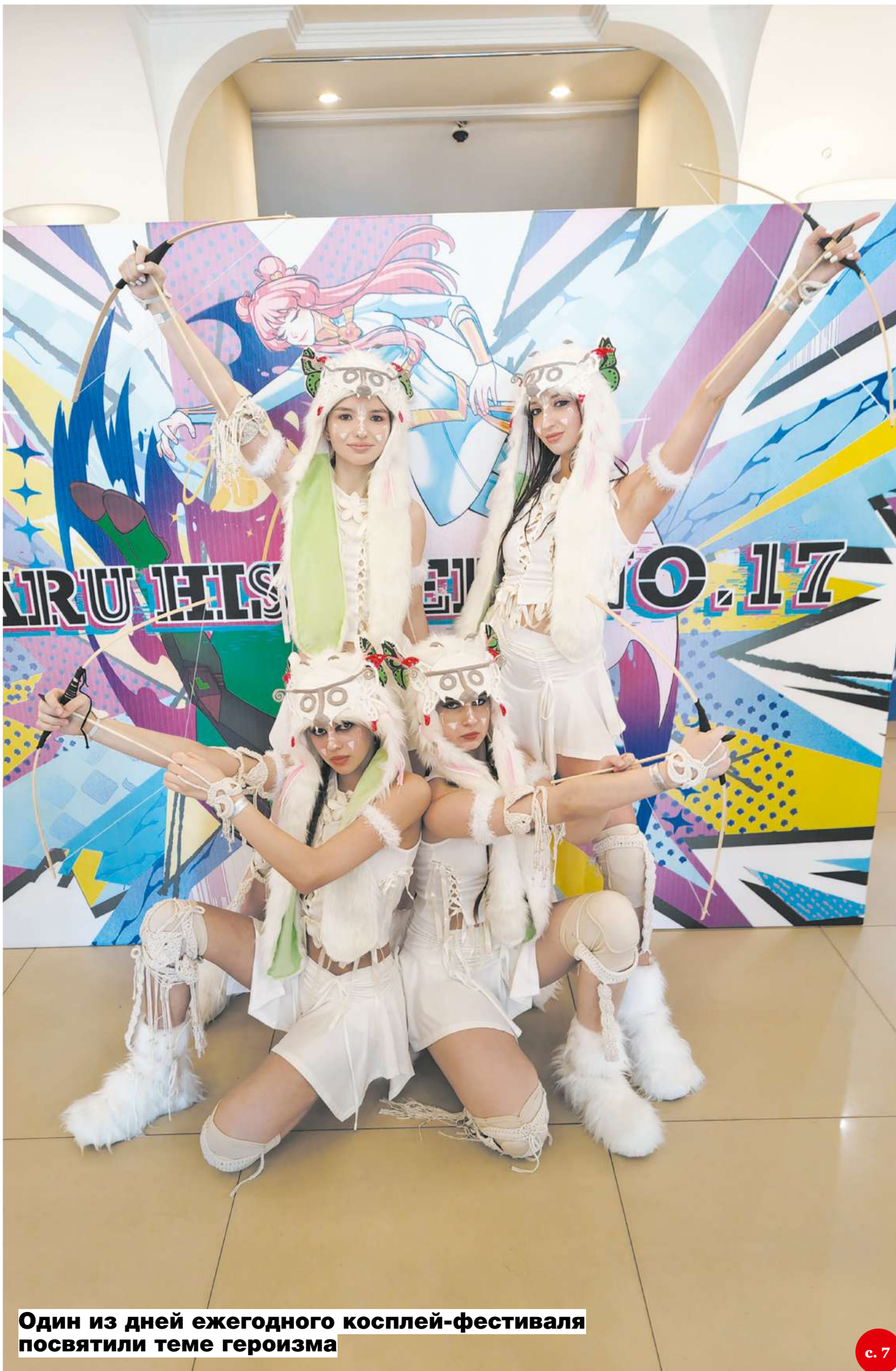
Один из дней ежегодного косплей-фестиваля посвятили теме героизма