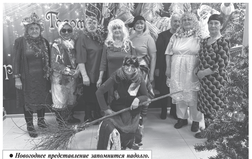
● Новогоднее представление запомнится надолго.

Е. ШВЕЦ, директор Дома культуры пос. Галичный.