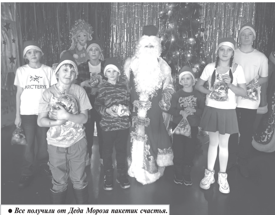
● Все получили от Деда Мороза пакетик счастья.

Накануне Нового года тихий воздух поселка Кенай наполнился предвкушением чуда. А само волшебство, легкое и серебристое, словно иней, выбрало своим домом местный Дом культуры. Стоило только стемнеть, как знакомое здание преобразилось: оно засияло сотнями огоньков, отбрасывающих на пушистый снег таинственные тени. Прохожие, даже просто спеша по своим делам, невольно замедляли шаг, окунаясь в эту живую сказку — в уютное сияние гирлянд и завораживающий хоронд сверкающих украшений.