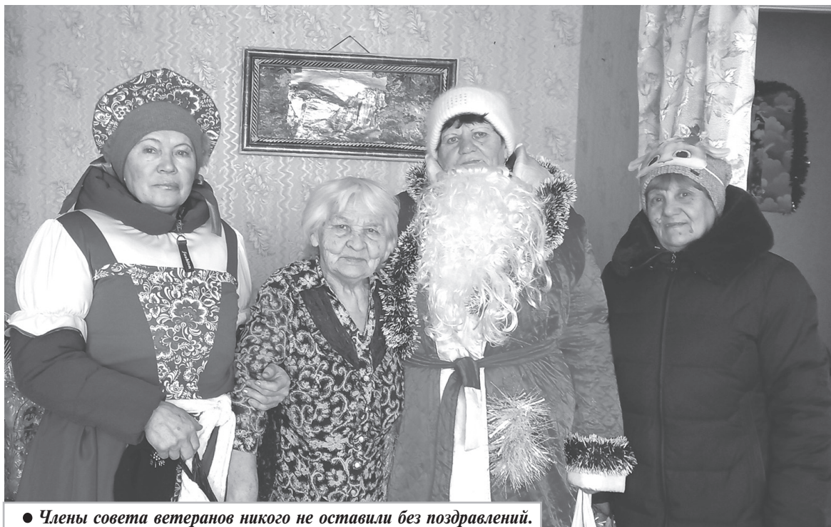
● Члены совета ветеранов никого не оставили без поздравлений.