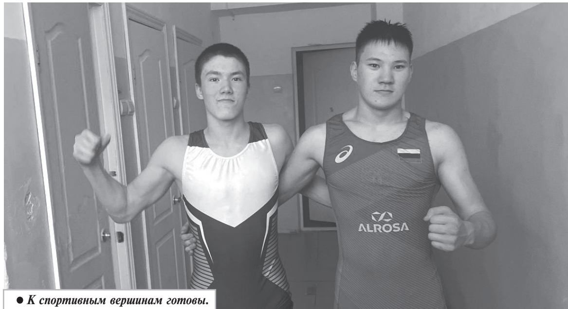
● К спортивным вершинам готовы.

День студента — это важный и радостный праздник, который объединяет всех учащихся и преподавателей, отмечая начало увлекательного пути в мир знаний и открытий. Этот день символизирует яркую студенческую жизнь, наполненную не только учебой, но и дружбой, самостоятельностью, ответственностью и мечтами о будущем.