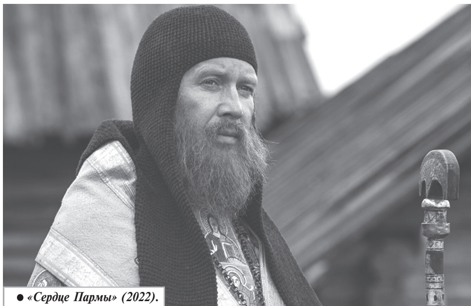
● «Сердце Пармы» (2022).