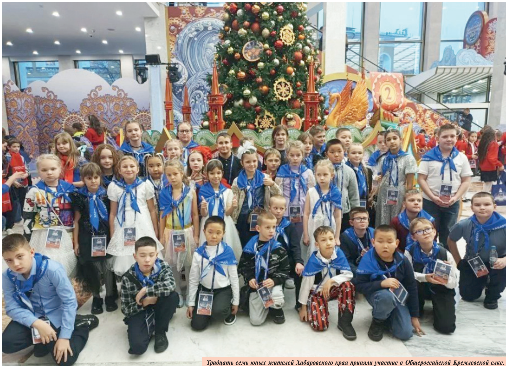
Тридцать семь юных жителей Хабаровского края приняли участие в Общероссийской Кремлевской елке.