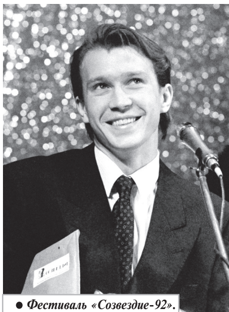
● Фестиваль «Созвездие-92».