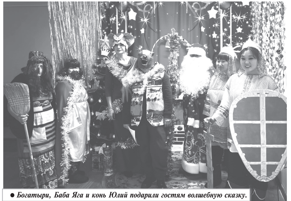
● Богатыри, Баба Яга и конь Юлий подарили гостям волшебную сказку.

Были проведены итоги конкурса «Семейная елка», организованного