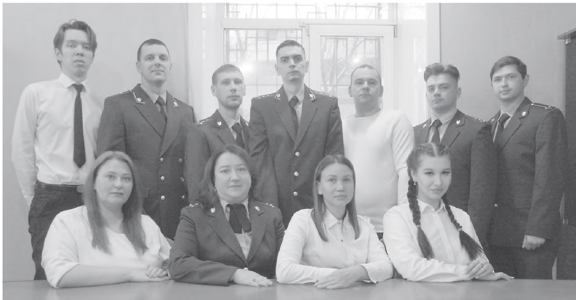
Коллектив прокуратуры слаженный и работоспособный.

В 2025-м в прокуратуру обратилось более 600 лазовцев. По многим обращениям принимались меры прокурорского реагирования. Много было жалоб в адрес судебных приставов