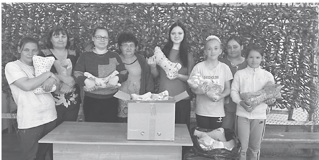
Подушки-«косточки» очень нужны раненым.

Дружно пересмотрели несколько мастер-классов по плетению сетей, изучили, какой материал нужно использовать. Оказалось, что хлопчатобумажная ткань в этом деле не годится, так как она прекрасно просматривается ночью через тепловизоры. Настоящей же