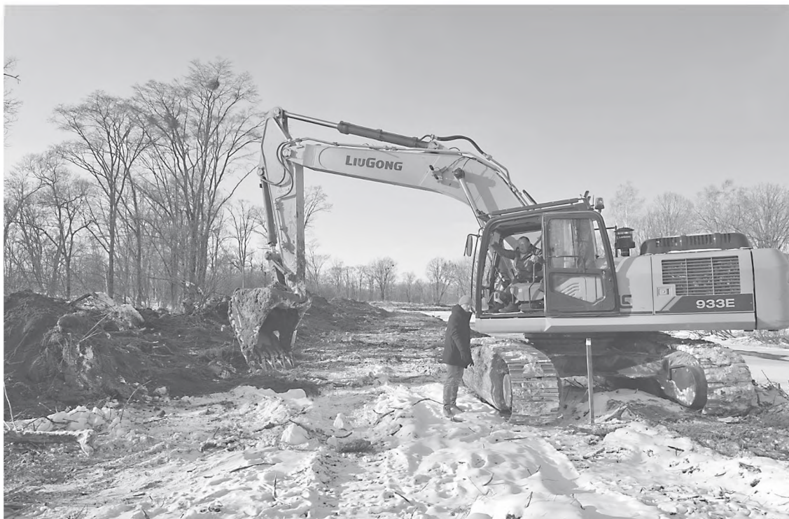
Ежедневно на реке работает тяжёлая техника.