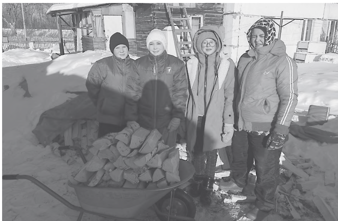
«Первые» в каникулы активно помогали семьям участников СВО.

Свою лепту в поддержку земляков, чьи родные и близкие защищают родину в зоне СВО, внесли и «Первые» Полетного