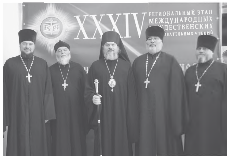
Представители Ванинской и Переяславской епархий.