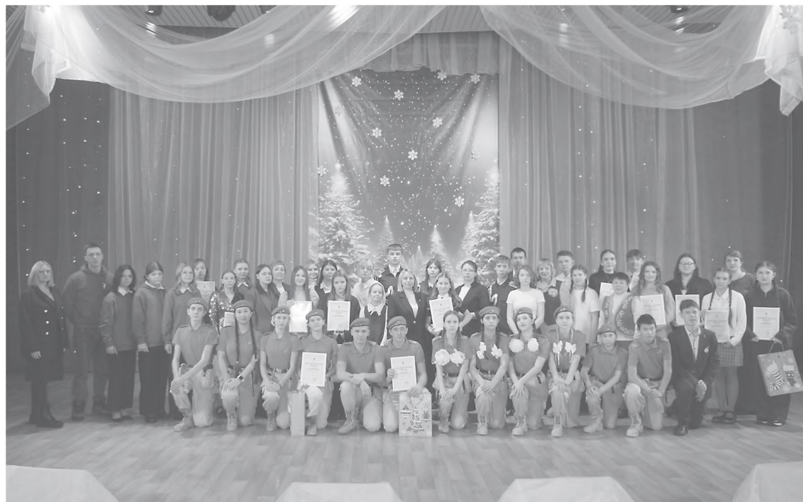
Торжественный приём одарённых детей и талантливой молодёжи.