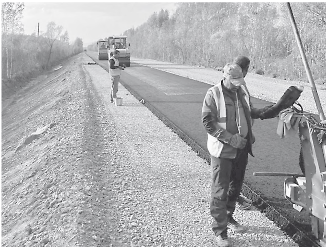
В прошлом году на ремонт и содержание дорог край выделили району более 20 млн рублей.

Помимо этого, семь поселений района (Переяславка, Хор, Мухен, Бичевая, Марусино, Полетное, Сита) получили краевую субсидию на мероприя-