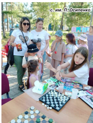
с. им. П. Осипенко