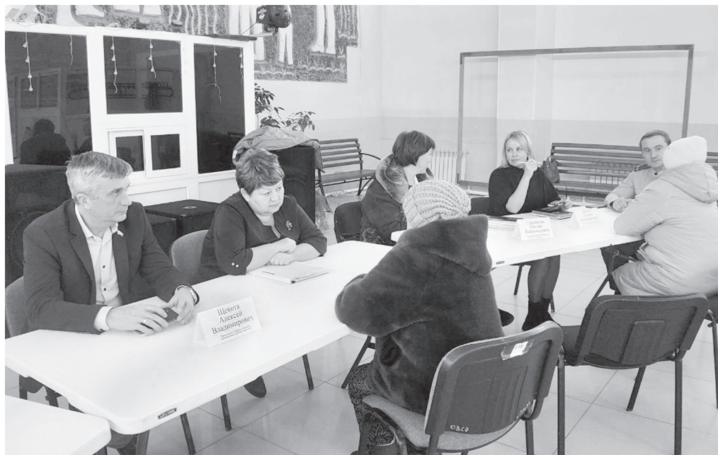
Прием родственников бойцов СВО

Успешно работает в поселении сельскохозяйственный кооператив «Лазовские продукты», специализирующийся на выращивании и переработке овощей. Несколько лет назад здесь за счет грантовой поддержки были построены небольшой перерабатывающий цех и храни-