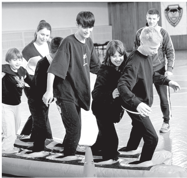
п. Хор. Командная пробежка на надувных «лыжах»

Декада инвалидов, которая проходила в районе в с 1 по 10 декабря, была приурочена к Международному дню инвалидов и отмечена спортивными мероприятиями.