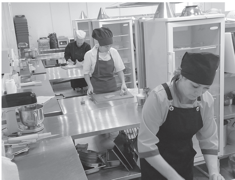
Бесплатно обучаемся на повара.

В следующем году стартует новый национальный проект «Кадрь», в рамках которого наши земляки также могут бесплатно получить новую профессию.