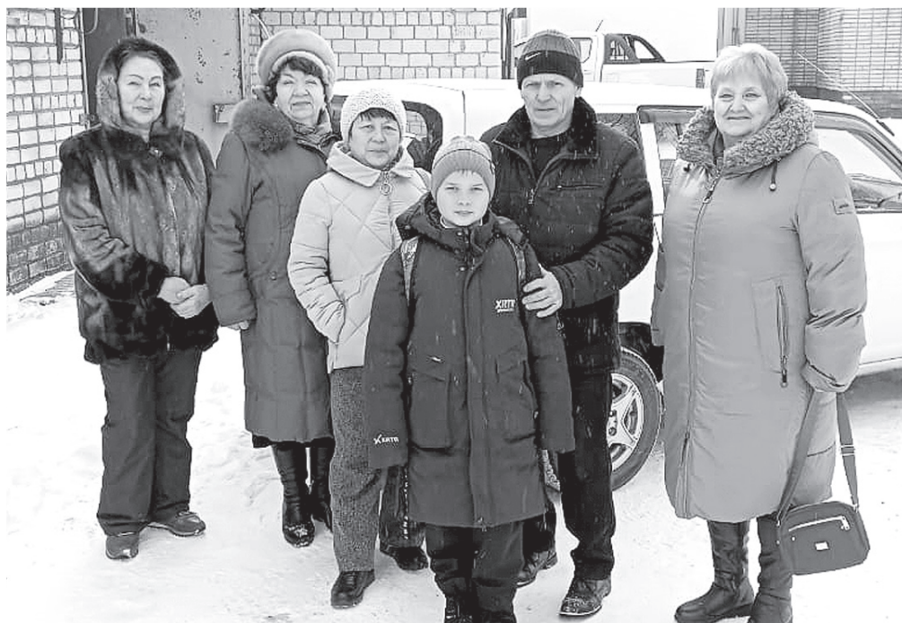
Приехали к раненым бойцам в больницу.

30 бойцов СВО, прибывших в Хабаровск на лечение из разных уголков страны, взяли под свое шефство «серебряные» волонтеры из поселка Хор.