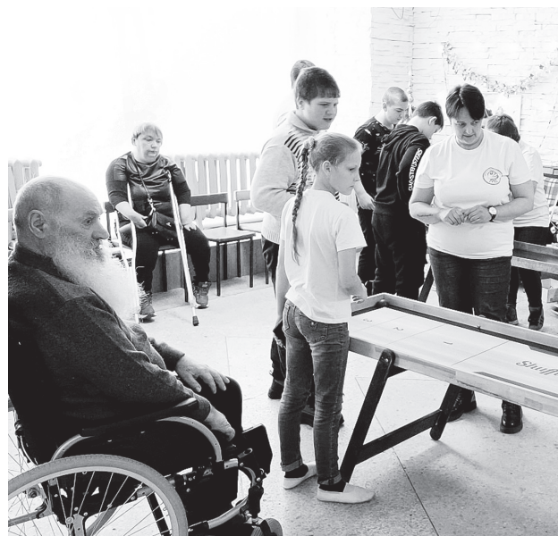
п. Мухен. Спортивный праздник – для детей и взрослых