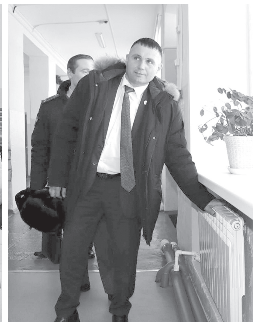
Объект внимания главы района – школа.

лище для готовой продукции. В нынешнем году, благодаря господдержке в виде гранта в 10 млн. руб., у предприятия появилось новое оборудование – транспортер для сбора капусты, специальная мойка для овощей, грузовой автомобиль. Это позволило ускорить процесс сбора, переработки и транспортировки овощной продукции.