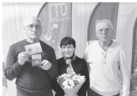
«Золотые» значки ГТО – нашим ветеранам спорта.

По результатам фестиваля ребята получают золотые, серебряные и бронзовые значки.