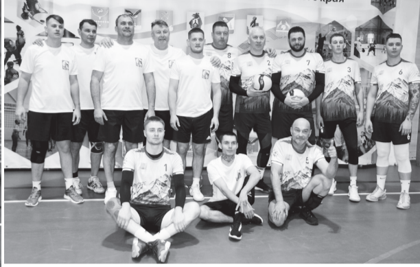
Волейбольные команды из района им.Полины Осипенко (слева) и Охотска.