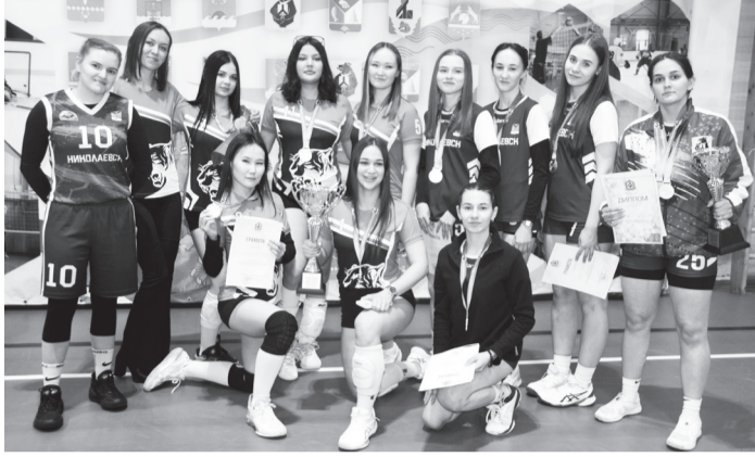
Команды «Динамо» и Аяно-Майского района.