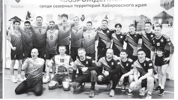
Победители мужского волейбольного турнира из Де-Кастри (слева) и команда из Аяно-Майского района.

23 февраля в 18.30 состоялась церемония закрытия XI краевого физкультурно-спортивного фестиваля «Возрождение» среди северных территорий Хабаровского края. Под звуки спортивного марша команды вышли и построились по периметру зала, гости заняли свои места, ведущие объявили, что фестиваль «Возрождение» состоялся. Настали минуты награждения победителей и призёров соревнований. Танцевальный подарок под названием «Метелица» исполнил для гостей спортивного праздника коллектив с говорящим названием «Улыбка Пятой». Ведущие отметили, что сегодня на соревнования собрались шесть районов – шесть больших семей, все