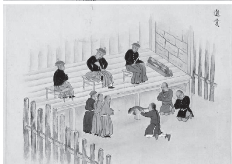
На фото представлено: общий вид административно-торговой конторы маньчжуров в местечке Дэрэн во время путешествия Мамия Риндо; вид балаганов, в которых жили туземцы во время ярмарки в Дэрэне, а также зарисовки непосредственно торгового обмена.