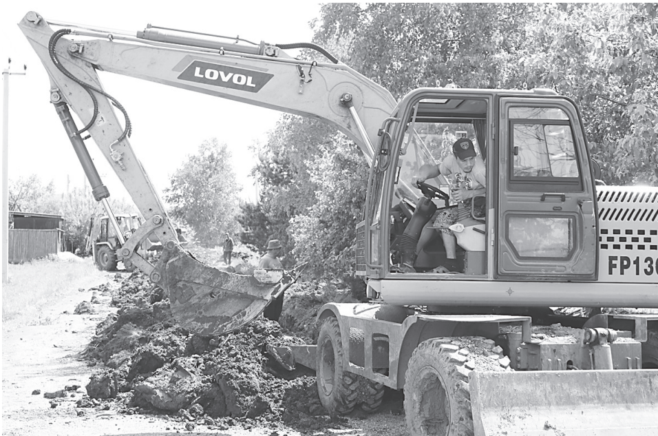
Строительная бригада работает на ул. Амурской

В Вяземском продолжается догазификация городских микрорайонов.