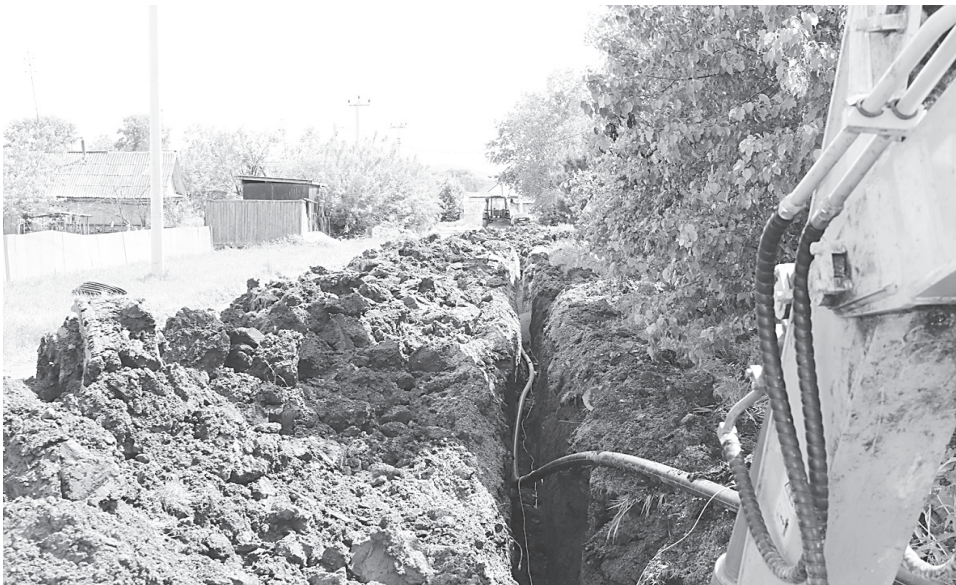
Укладка газовой трубы в траншею