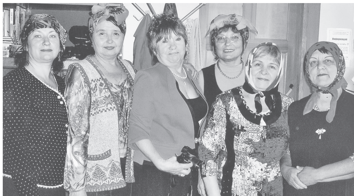
Коллектив театра в селе Венюково после спектакля «Акулы двора», 2015 год

– Как известно, в стране поставлена задача к концу 2024 года создать в каждой школе свои театральные кружки. Такие коллективы нужны в сельских Домах культуры. Специалистов, обладающих профессиональными навыками в области театрального искусства, в нашем районе не так много, а их объединение позволит сконцентрировать опыт театральных специалистов на благо развития театрального движения района. Поэтому организация театрального цен-