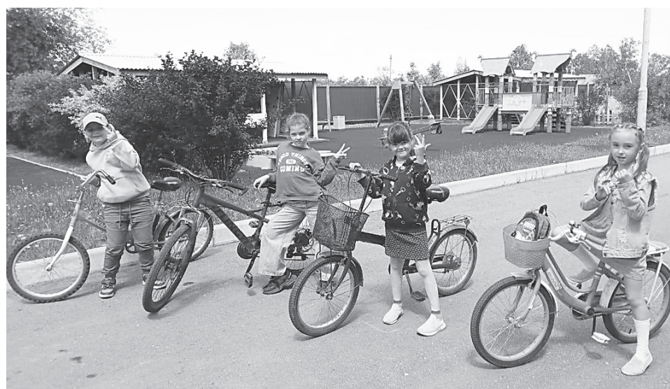
Активный отдых детей на каникулах

Также подростки на время летних каникул смогут трудоустроиться. С КГКУ «Центр занятости населения города Вяземский» заключили 12 договоров со всеми школами района.