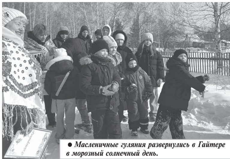
● Масленичные гуляния развернулись в Гайтере в морозный солнечный день.

Много интересных праздников у русского народа, а один из самых разудалых да запоминающихся — «блинная неделя» или Масленица. Со времен язычества она знаменует проводы зимы и встречу весны.