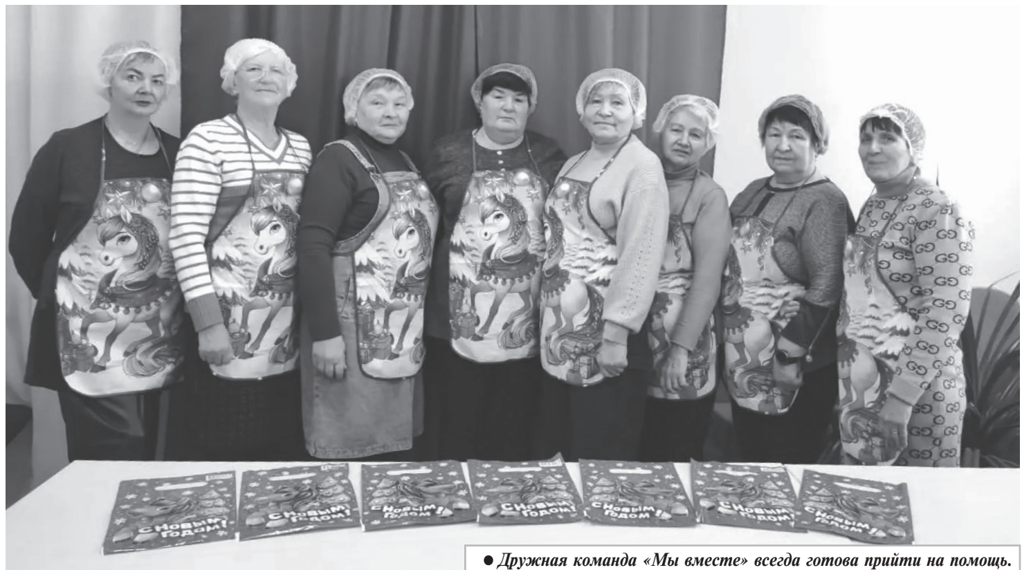
● Дружная команда «Мы вместе» всегда готова прийти на помощь.

Еще стараемся по возможности поддерживать связь с нашими ре-