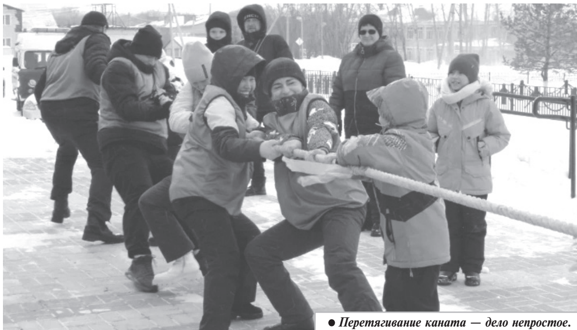
● Перетягивание каната — дело непростое.

Вот и закончилась Масленичная неделя. В Прощеное воскресенье возле Дома культуры Ягодного, разносясь над всем поселком, звучала веселая музыка и задорный смех.