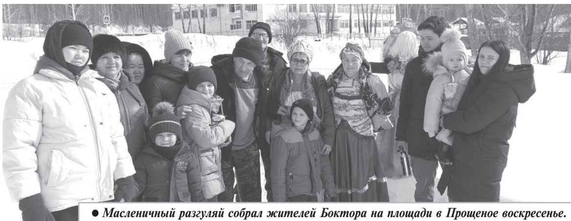
● Масленичный разгуляй собрал жителей Боктора на площади в Прощеное воскресенье.

Е. БОРИСОВЕЦ, директор Дома культуры.