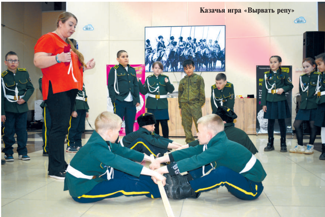
Казачья игра «Вырвать репу»