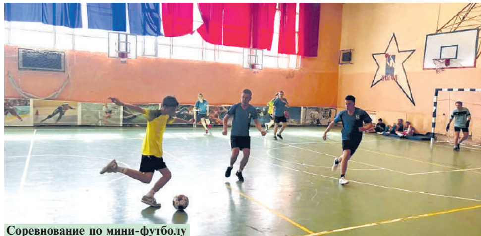
Соревнование по мини-футболу

Спортивная школа имени И. А. Мусатова стала прекрасной площадкой для проведения этого яркого события, а юные футболисты подарили зрителям незабываемые эмоции и продемонстрировали, что будущее российского спорта в надёжных руках.