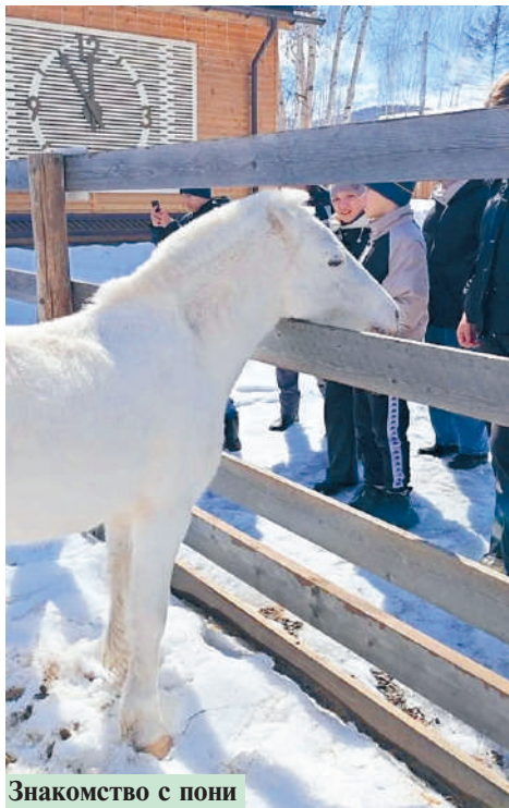
Знакомство с пони

Весна – время пробуждения природы, время новых впечатлений и радостных открытий. И для воспитанников Детского дома №27 эти весенние каникулы стали особенными. Вместо привычных горных пейзажей ребята отправились в место, где природа говорит без слов, где каждый шорох и каждый взгляд наполнены смыслом – на живописное озеро Хрустальное. И там их ждал настоящий сюрприз – удивительный живой уголок, полный дружелюбных обитателей: пушистые кролики, звонкоголосые куры, ласковые козы и, конечно же, грациозные пони. Ребята с восторгом погрузились в мир животных, где каждый мог почувствовать себя частью природы. Они с не-