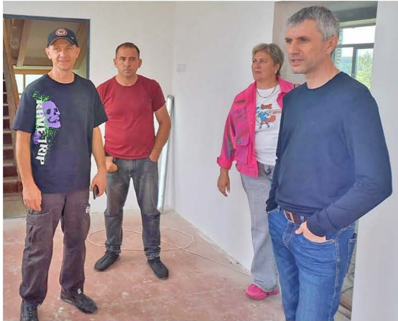
Окончание. Начало читайте на 1-й стр.

После завершения большого спортивного праздника "Движение Вверх", который проходил в День физкультур-