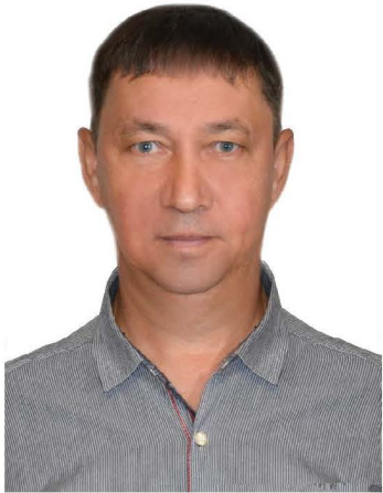
Агитационный материал опубликован на бесплатной основе

кандидат в депутаты Собрания депутатов Советско-Гаванского муниципального района