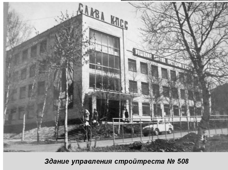
Здание управления стройтреста № 508

монтный завод Министерства рыбного хозяйства СССР, База океанического рыболовства, порт Ванино, а также жилмассивы для работников этих предприятий. Появились комбасный и молочный заводы, химзастка, завод железобетонных изделий, птицефабрика. На стройках города трудилось только 2000 человек вольнонаёмных и до 500 заключённых.