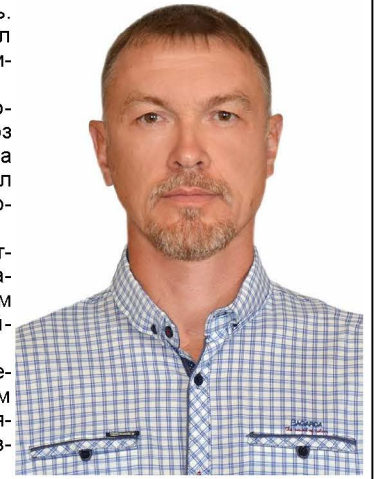
Агитационный материал опубликован на бесплатной основе

кандидат в депутаты Собрания депутатов Советско-Гаванского муниципального района