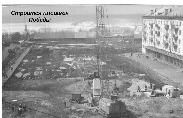
Строится площадь Победы

Мощными темпами строились завод № 1 Министерства морского флота СССР, Северный судоре-