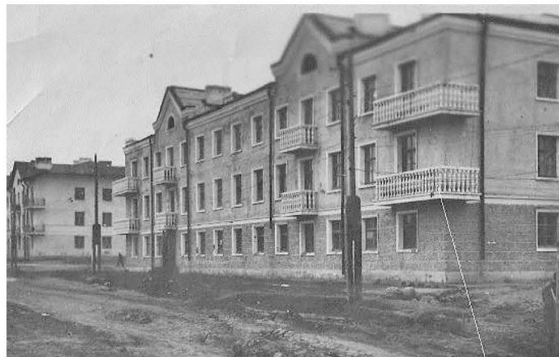
Улица Ленина (Приморская), площадь Строителей. Первые каменные дома, 1952 год