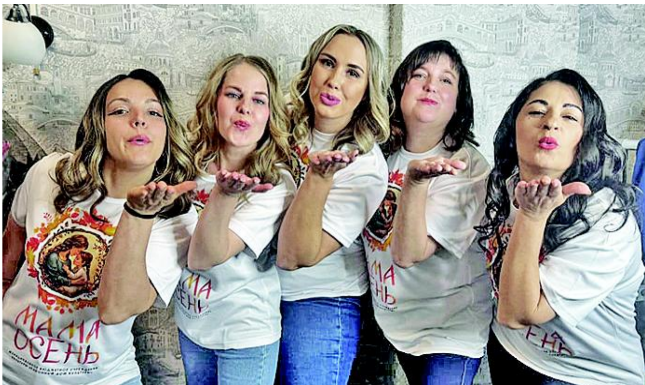
Очаровательные участницы конкурсной программы, приуроченной ко Дню матери