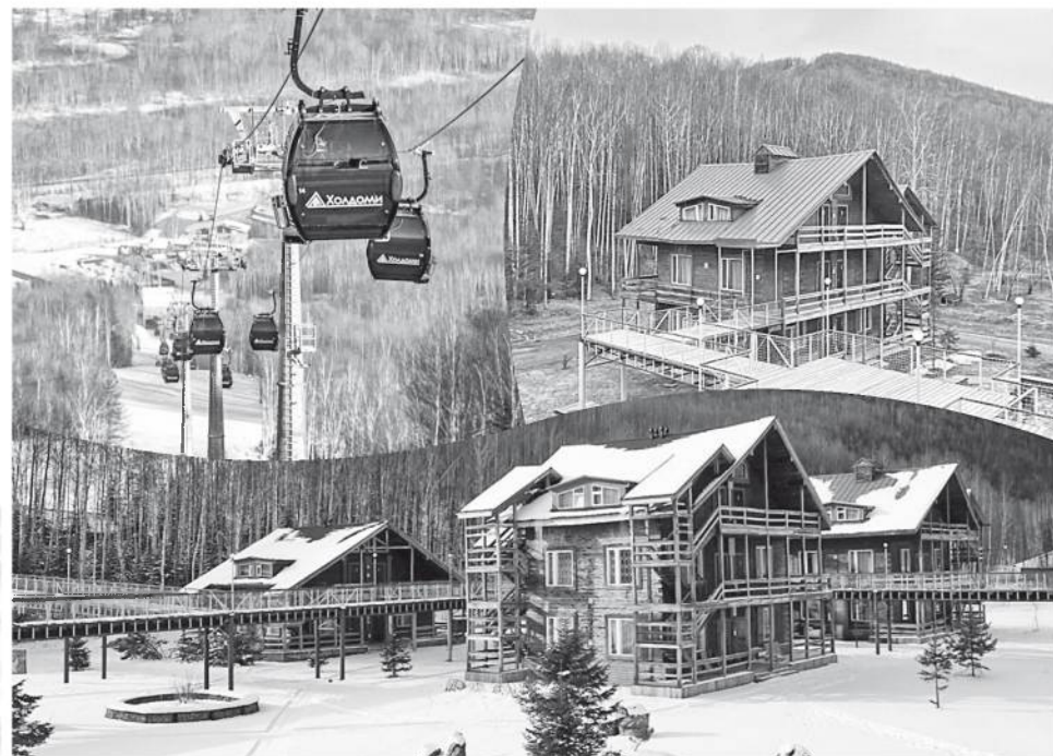
КОЛЛАЖ: ЕВГЕНИЙ АЛЕКСЕНКО

ЧЕБУРАШЕК ВОЕННОСЛУЖАЩИЕ МОГУТ НОСИТЬ С СОБОЙ НА ПОЯСНЫХ РЕМНЯХ, РЮКЗАКАХ, В НАГРУДНЫХ КАРМАНАХ.