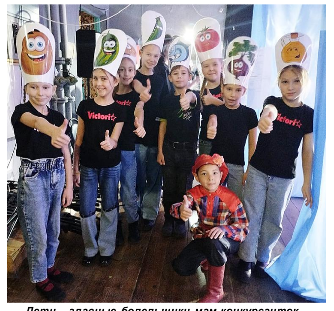
Дети - главные болельщики мам-конкурсанток

В перерывах между конкурсами звучали замечательные музыкальные композиции, исполненные ан-