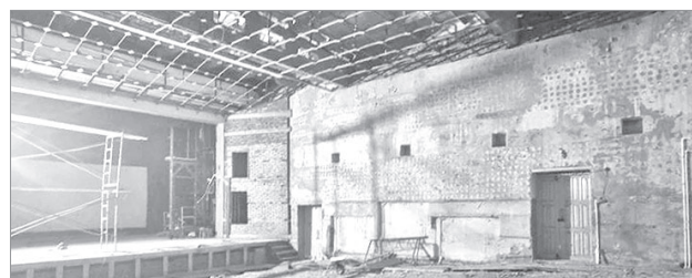
Зрительный зал в Лидоге