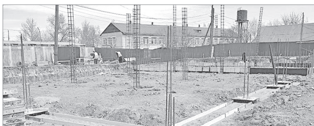
Дом культуры в Маяке