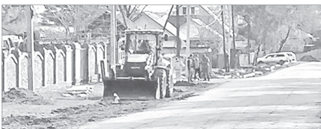
Тротуары в райцентре