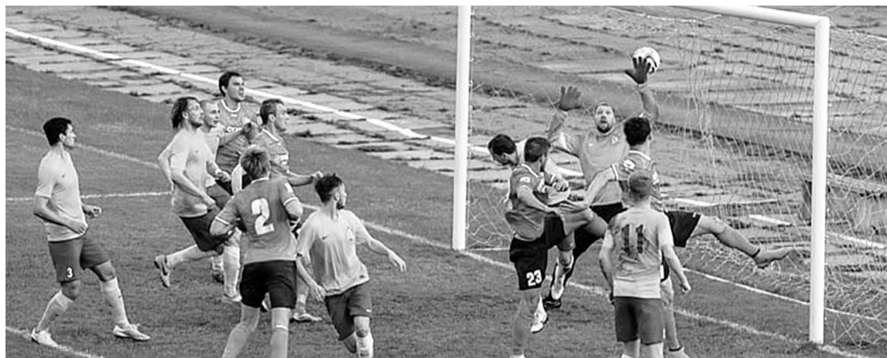
О каком повышении класса можно вести речь, если футболисты «Смены» едва сводят концы с концами.

Будущее футбола в городе юности под большим вопросом