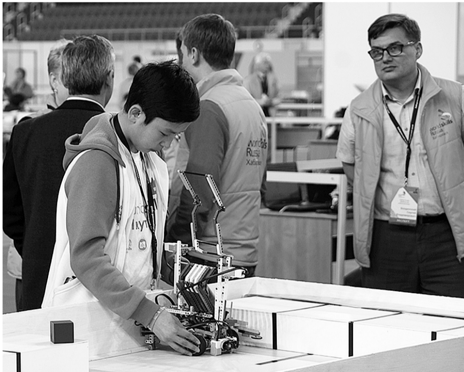
Участие в масштабном соревновании дает школьникам возможность подняться в дальнейшем на высшую ступень мастерства.