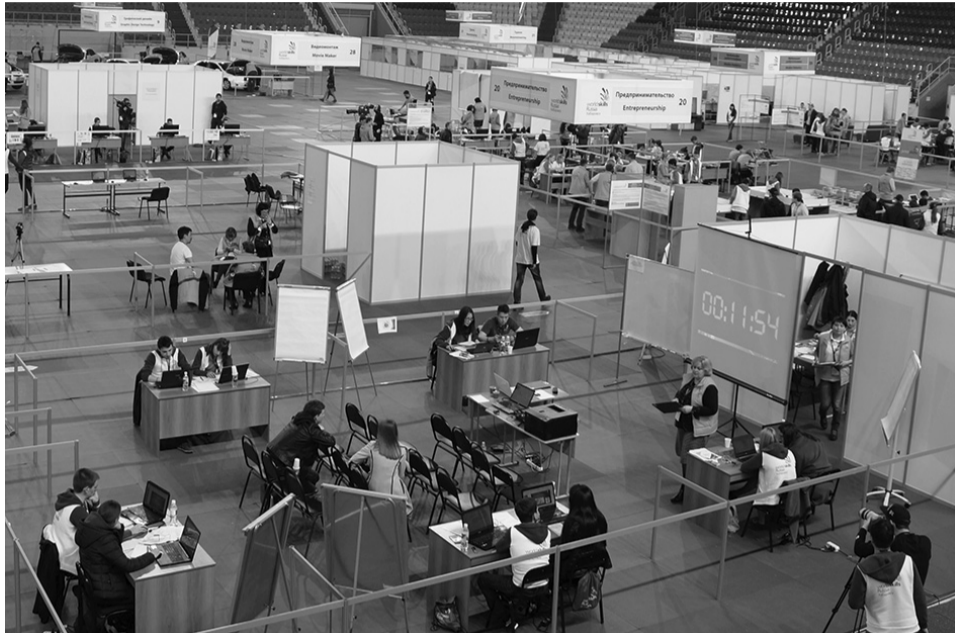
За каждой площадкой были закреплены волонтеры, а также эксперты.

Обширная деловая программа стала визитной карточкой чемпионата. В течение трех дней в формате стратегических и экспертных сессий, «круглых столов», мастер-классов, дискуссионных площадок, открытых лекций почти 500 специалистов обсуждали актуальные вопросы образования, науки, инноваций, экономики, инвестиций. По словам губернатора Вячеслава Шпорта, новая экономика региона нуждается в специалистах, подготовленных по международным стандартам. Для Хабаровского края это особенно важно, так как здесь сосредоточены крупные промышленные предприятия, созданы территории опережающего социально-экономического развития (ТОСЭР). В ближайшие три — четыре года экономике края потребуются около десяти тысяч профессиональных рабочих практически всех специальностей.