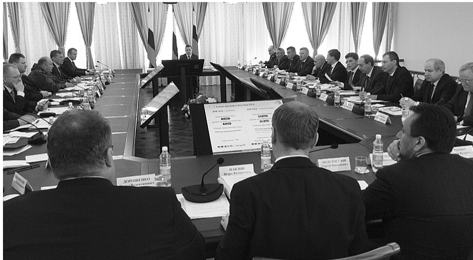
Одним из вопросов повестки дня заседания совета в Петропавловске-Камчатском, в котором принял участие также губернатор Хабаровского края, была подготовка ко II Восточному экономическому форуму.