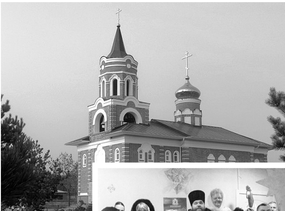
Храм святого Димитрия Донского.