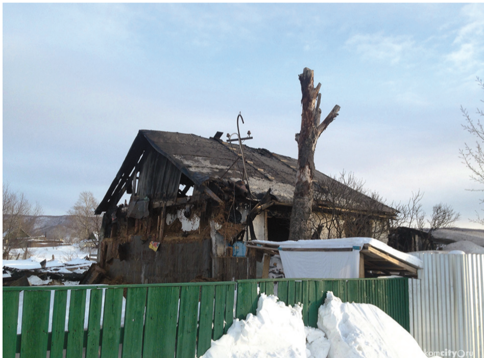
Итог поджога сухой травы в одном из садовых товариществ в окрестностях Комсомольска-на-Амуре.

— Опахка по периметру населенных пунктов уже началась, именно таким методом предстоит защитить к началу мая более десяти сел на подконтрольной территории, — констатирует начальник отдела по вопросам безопасности и гражданской защиты администрации