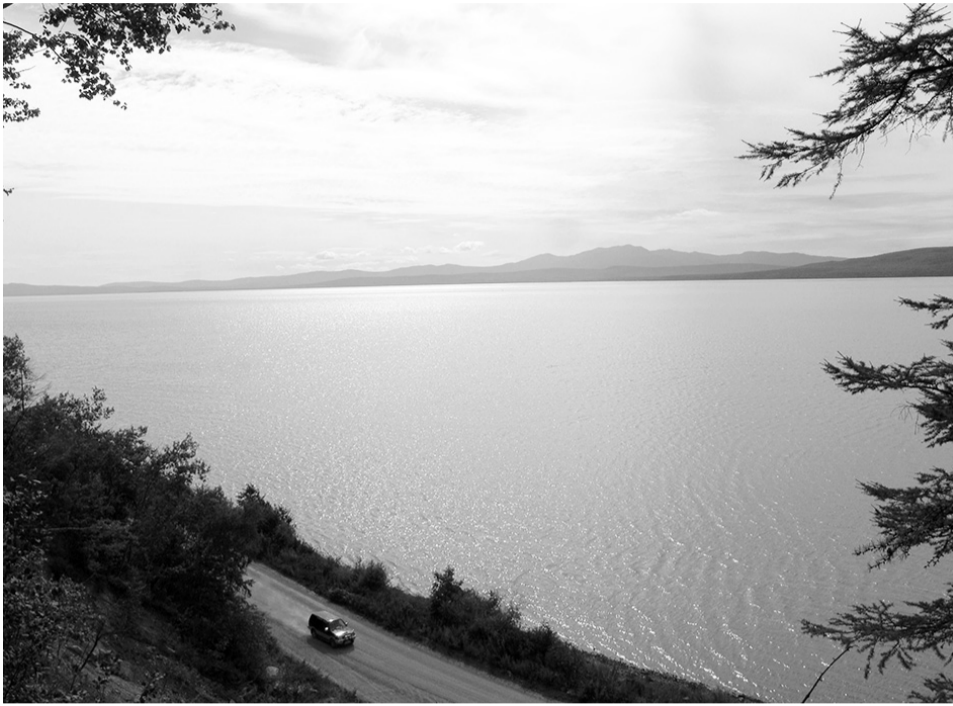
Лиман Амура по сей день скрывает тайны древности.

Географические названия на картах Ремезова и Делиля не совпадают с современными названиями разве что у крупных объектов. Таких, как река Амур, озеро Байкал, полуостров Камчатка. Одна-