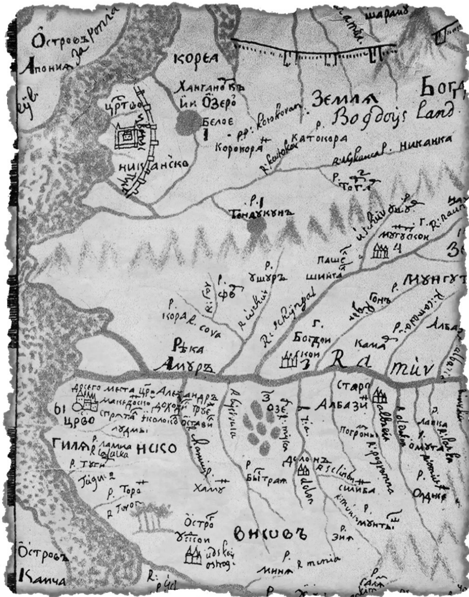
Фрагмент карты Семена Ремезова, 1701 год.

как ссылку на существование там города греческой цивилизации. Идею существования в том месте города можно подтвердить несколькими признаками. Во-первых, на языке нивхов, живущих на Нижнем Амуре, название мыса Чорбах в лимане Амура переводится как город. А ведь городов нивхи не строили никогда. Между тем космическая съемка пока-