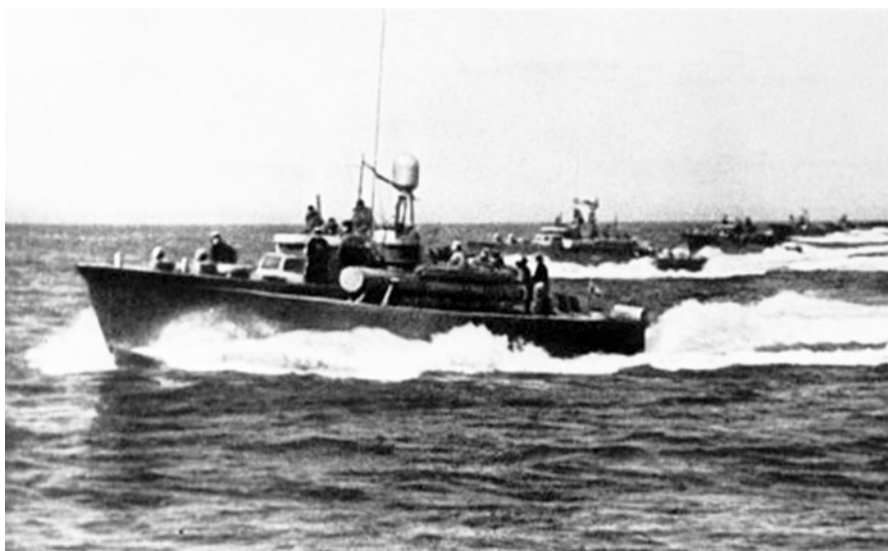
Десантные корабли взяли курс на Тейсин.