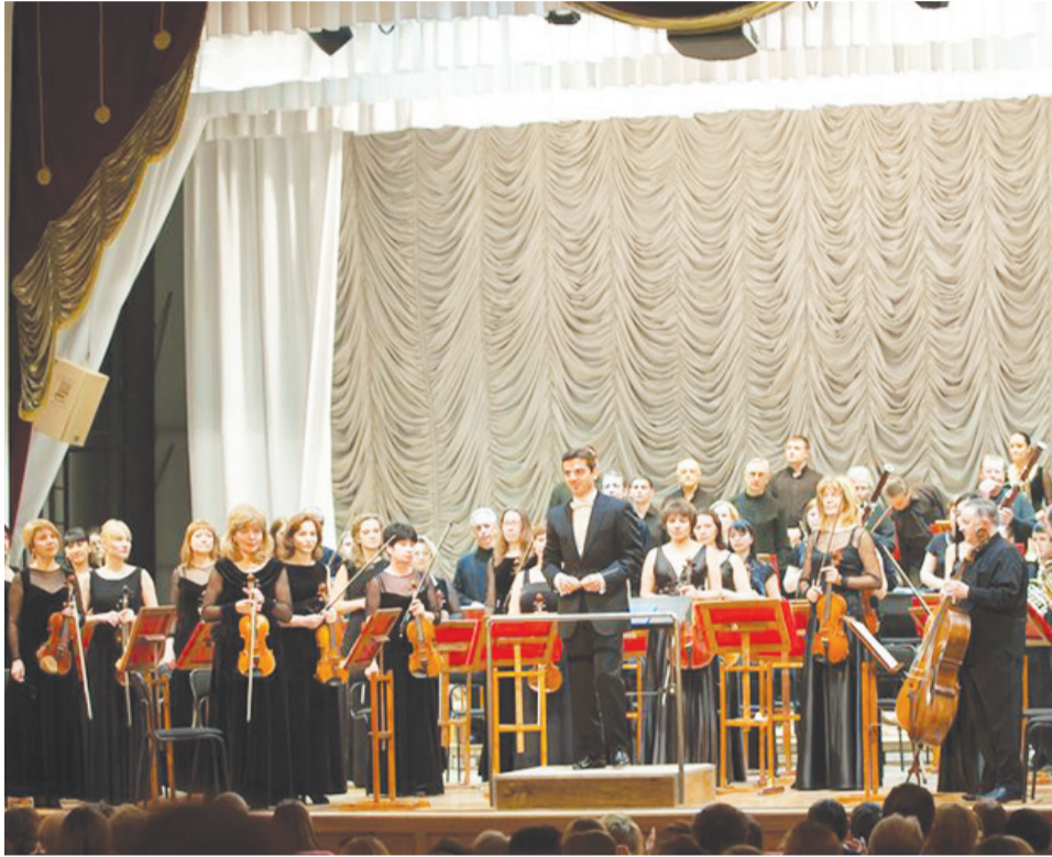
В предстоящем сезоне в Дальневосточном академическом симфоническом оркестре появится новый главный дирижёр.

14 сентября Хабаровская краевая филармония открывает 78-й концертный сезон