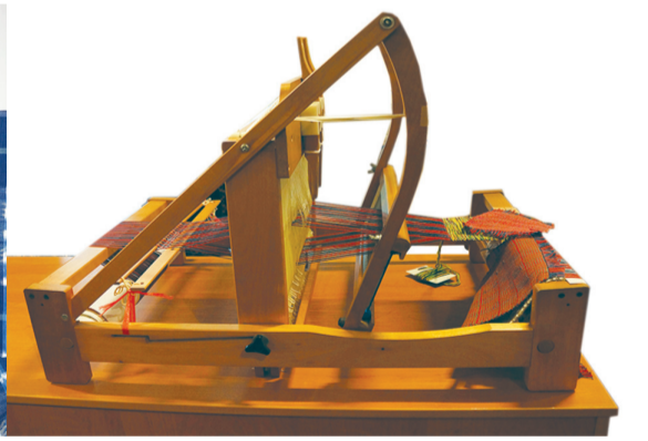
На выставке можно соткать простое полотно.

честве приданого невесте. Каждый узор на них имеет какое-то значение. Например, изображение насекомых на одежде означает плодородность в семье.