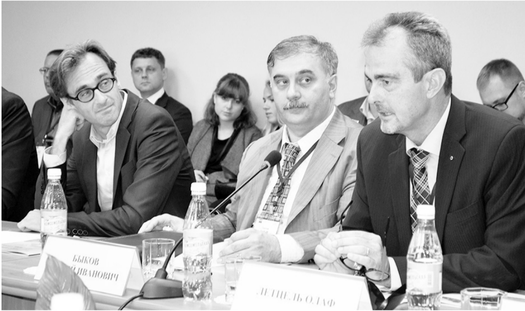
Партнеры из ФРГ настроены на сотрудничество с индустрией Комсомольска-на-Амуре.

Более десяти соглашений, подписанных на Восточном экономическом форуме, становятся сегодня дополнительным импульсом развития ТОСЭР в городе юности