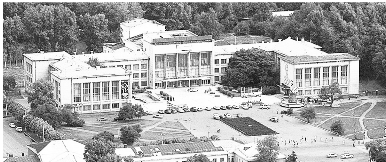
И лишь стены дворца остаются «лакомым местом» для размещения рекламных баннеров...

Топ-менеджерский азарт превращает объект культурного наследия в «залежалый товар»?