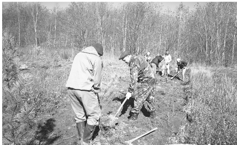
Лесовосстановлением когда-то здесь ежегодно охватывалось до ста пятидесяти гектаров.