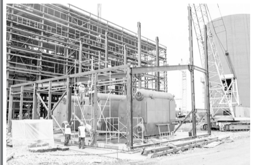
Все три котла ТЭЦ уже установлены на фундамент.