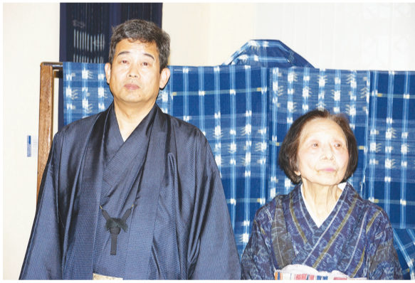
Мастера ткачества из Японии.