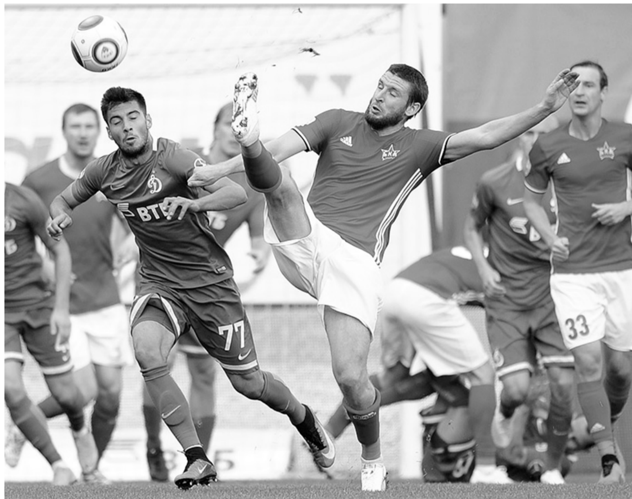
Такой футбол болельщикам по душе.

Команда «СКА-Хабаровск» покидала столицу с высоко поднятой головой