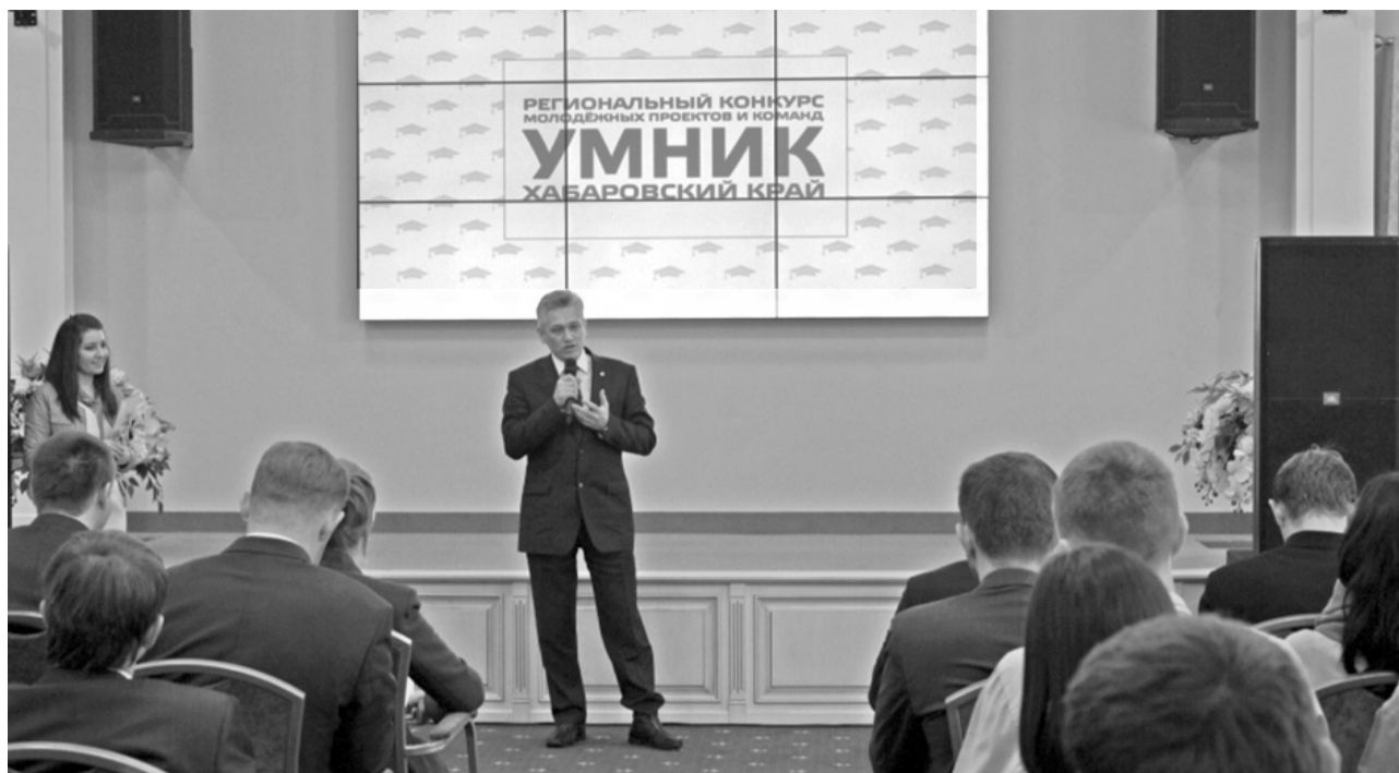
«УМНИК» — поэтапная программа, инструмент для закрепления молодых специалистов на предприятиях края.