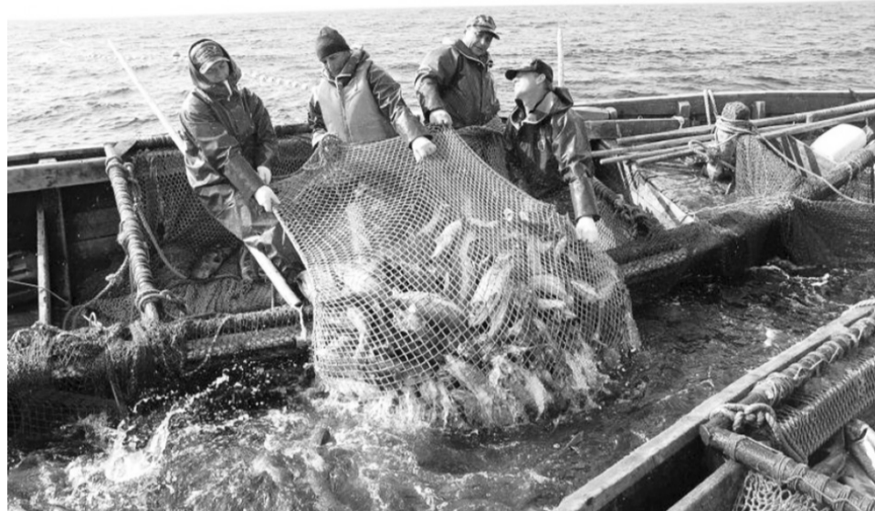
Рыбаки ставят рекорды за рекордом, и только строительство цехов и холодильников позволит значительно увеличить объемы береговой переработки рыбы.

К 2020 году предприятия рыбной отрасли, согласно планам краевого правительства, должны нарастить объемы вылова на 14 процентов и достичь 360 тысяч тонн в год, ежегодно перерабатывать на берегу до 80 тысяч тонн рыбы. Общий объем производства достигнет 300 тысяч тонн в год. Будут сформированы дополнительные транспортно-логистиче-