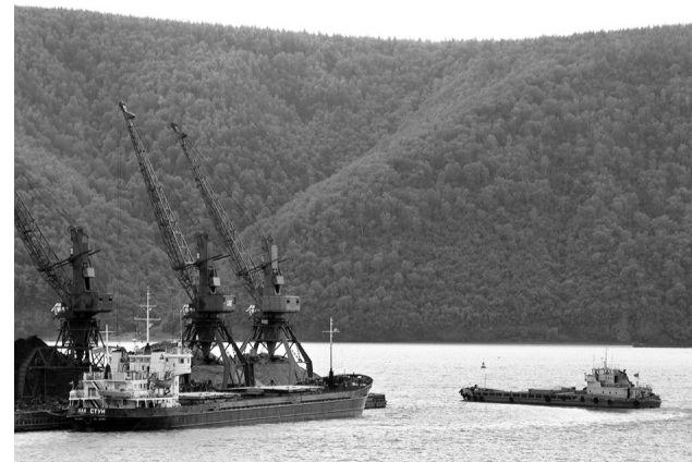
Несколько нормативов — в интересах жителей северных территорий.

«Этот документ во многом революционный и поможет нам решать социальные задачи, повышать благосостояние жителей края. Впервые мы приняли сразу несколько нормативов, в первую очередь это было сделано в интересах жителей северных территорий, где условия более суровые и уровень цен там выше.