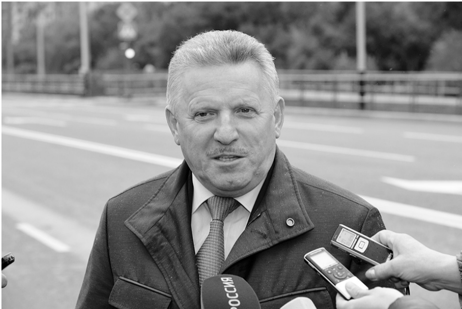
Вячеслав Шпорт: «Хабаровский край достаточно протяженный по площади, и у населения справедливо появляются вопросы о регулярных пассажирских перевозках, качественных дорогах».

В 2016 году развитие автотранспортных магистралей