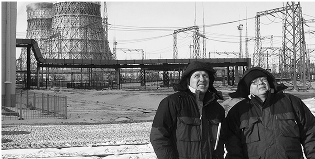
При газификации теплоэлектроцентралей не был утрачен их угольный потенциал, и это позволяет принимать меры для снижения убытков.

Та же проблема, но больших масштабов, у Хабаровской генерации, где переведены с угля на газ ТЭЦ в Комсомольске-на-Амуре, Амурске, Хабаровске. Правда, при газификации теплоэлектроцентралей не был утрачен их угольный потенциал, и это позволяет принимать меры для снижения убытков. В частности, менять топливный баланс, увеличивая использование угля.