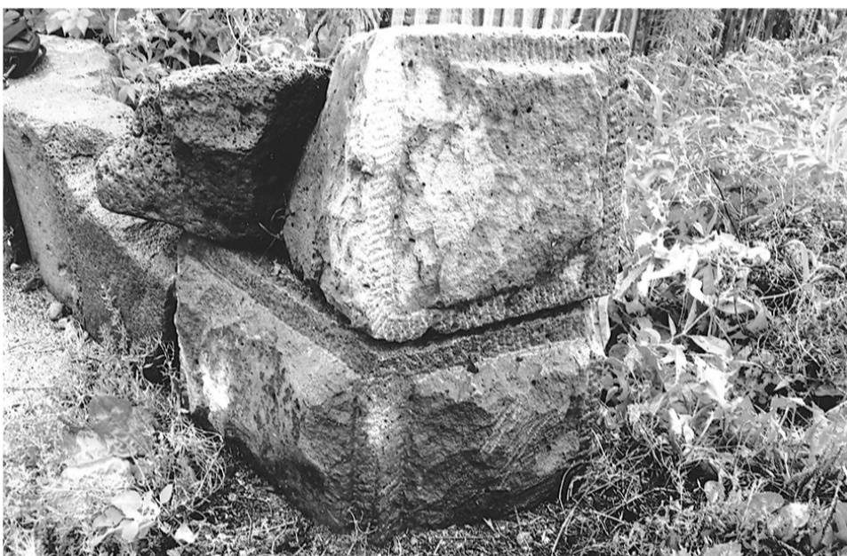
Ручная обработка стеновых камней.

Огромная проблема — бесконечное сопротивление атакам несметного количества кровососущих насекомых всевозможного разнообразия, что приводит к мысли о ее искусственном разведении. В этих местах даже красота природы какая-то неустрашающая, как временная и оставленная на дальнейшую последующую гармонию.