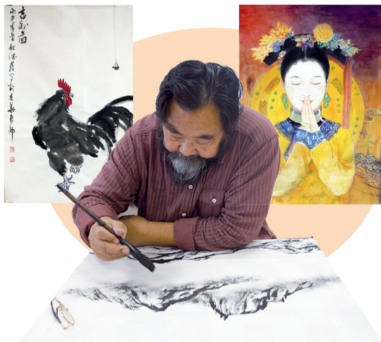
Множество точек или мазков кисти могут создать объемный образ лошади, реки...

— Мне очень нравится китайская живопись, каллиграфия. И я не прочь перенять некоторые приемы рисования у азиатских виртуозов, — говорит она.