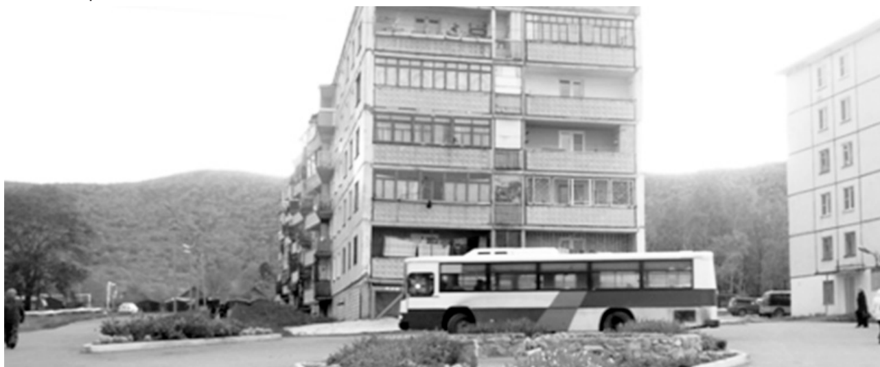
Центральная часть поселка сформирована пятиэтажками, построенными ещё в 1980-е годы Корфовским каменным карьером.