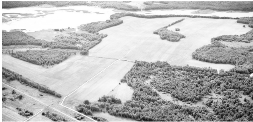
Велики просторы Хабаровского края, велик будет теперь и выбор гектара для земляков.

учение, а также ряд практиков, во время которых участники смогли закрепить полученные навыки, — пояснил Андрей Примаков. — Администрация района подробно рассказала о проблемах, с которыми могут столкнуться территории при оформлении участков. Скажу, что все районы уже готовы работать в полную силу. В общем, у нас получилась своеобразная свертка часов перед вторым этапом проекта».