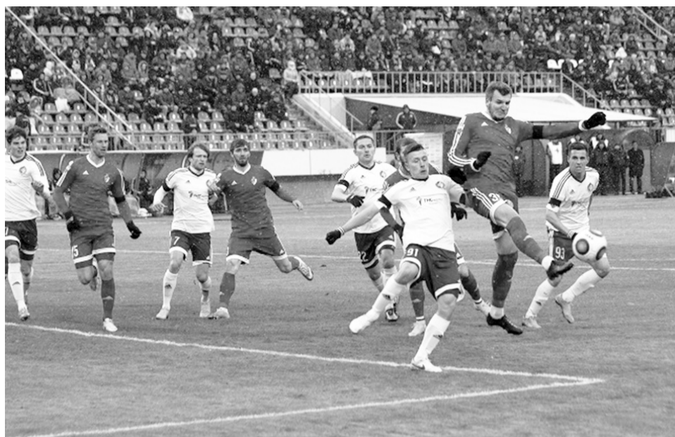
Армейцы пока непобедимы.