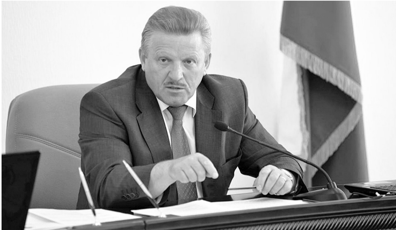
Губернатор Хабаровского края считает, что основными нарушениями со стороны должностных лиц продолжают оставаться несоблюдение обязанностей предоставлять сведения о доходах, имуществе и обязательствах имущественного характера.

Правительство края принимает меры по искоренению условий для дачи и получения взяток. Один из примеров — создание многофункциональных центров (МФЦ) по пред-