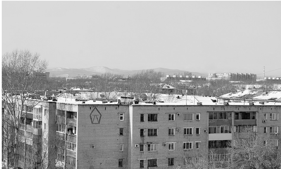
Восполнение ресурсов жилищного фонда Комсомольска-на-Амуре продолжается.

Как убедились рабочая группа, нет нареканий к специалистам и по другому адресу, где восстановлена система отопления.