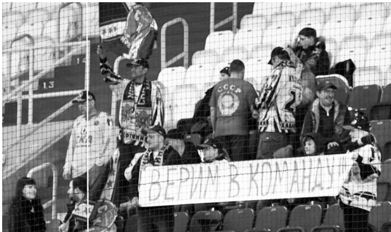
Болельщики, несмотря ни на что, верят в «СКА-Нефтяник».

«СКА-Нефтяник» продолжает борьбу за медали. Но за какие?