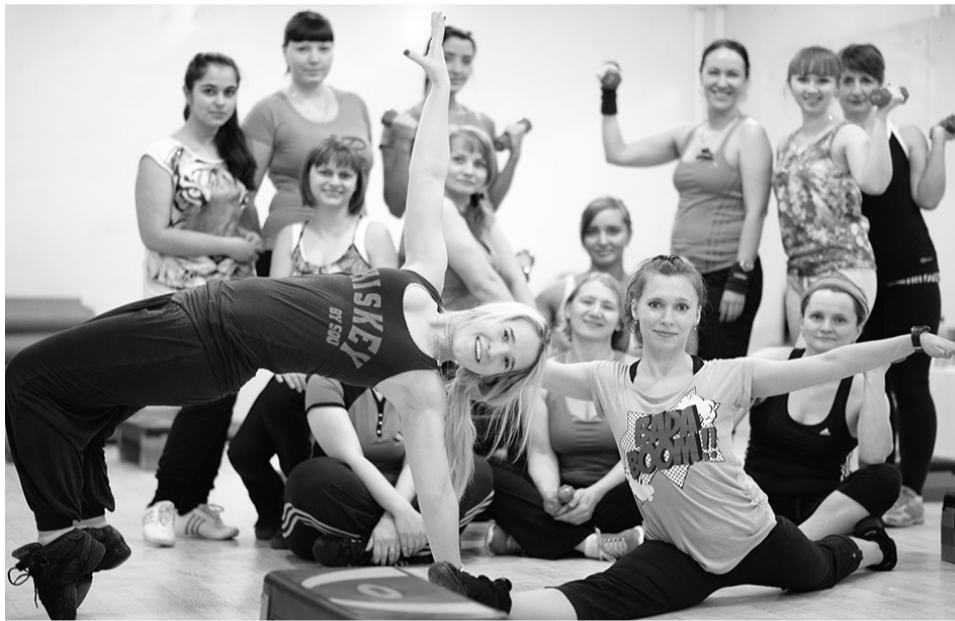
Подруги нашли себя в общем деле, организовав фитнес-студию.

В старших классах заметила, что начала полнеть. Пришлось заняться сначала