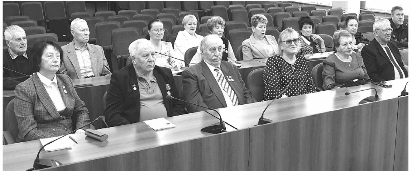
Ванинский районный совет ветеранов войны, труда, Вооружённых сил и правоохранительных органов