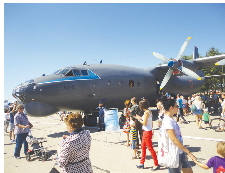
А самолеты сами не летают.