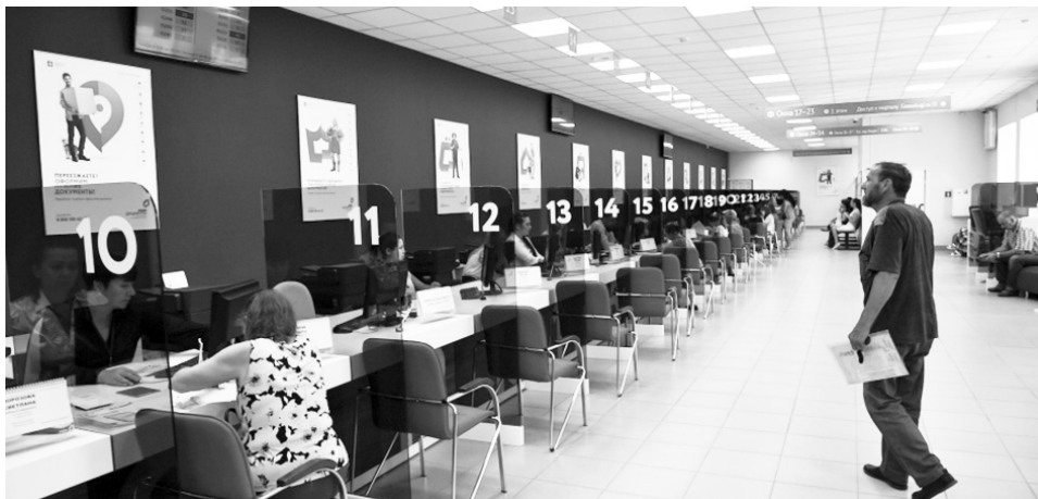
Есть нюансы и в регистрации юридического лица через многофункциональный центр.

Но в ходе обсуждения выяснилось, что так получается не всегда. По словам предпринимателей, один день,