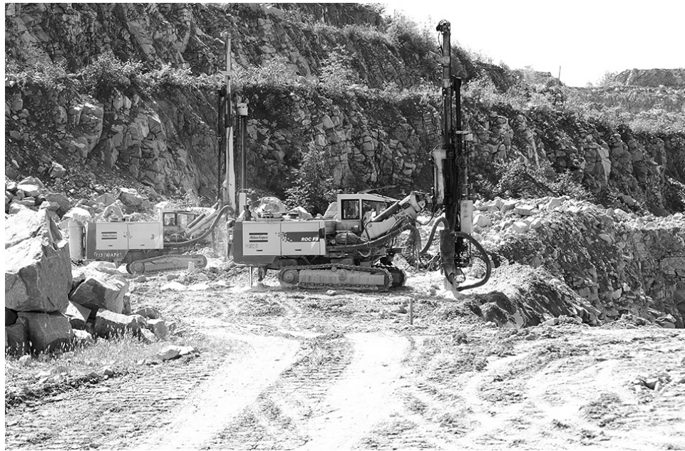
Первый в Корфовском «швед» — буровой станок фирмы «Атлас Копко».

Как «дочка» Корфовского каменного карьера добилась лидерства на буровзрывных работах