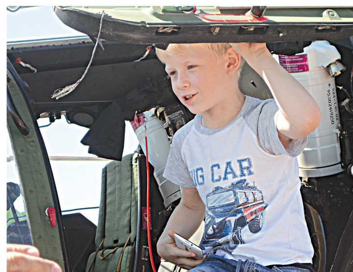
«Хочу быть летчиком!».