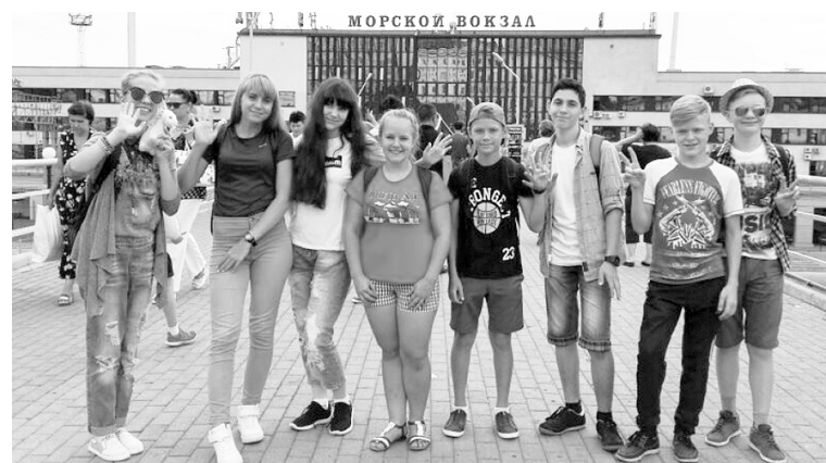
Местом проведения международного симпозиума выбран Владивосток, в Хабаровске форум в последний раз проходил в 2011 году.

«Экосистемы стран Азиатско-Тихоокеанского региона сильно взаимосвязаны. Состояние окружающей среды Дальнего Востока влияет на экологию соседней и наоборот. Поэтому международные контакты, посвященные этой теме, очень важны — как на взрослом, так и на молодежном уровне. Вернувшись в свои школы, дети смогут