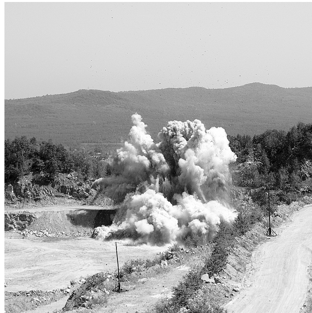
Взрыв венчает работу.

Клинья да кувалда — инструменты первых корфовских каменоломов. И, пожалуй, матушка-природа: в преддверии зимы в разломы и трещины заливали воду, она замерзала и по законам физики раздвигала пласты знаменитого корфовского камня — гранодиорита. С началом социалистического строительства примитивную дореволюционную технологию отменили: на добычу гранодиорита была мобилизована взрывчатка.