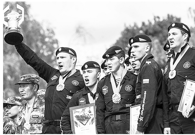
Курсанты Дальневосточного высшего общевойскового командного училища стали золотыми и серебряными призерами Игр.

В военно-медицинской эстафете не было равных от мотострелкового соединения ВВО из Хабаровского края, Тихоокеанского флота и управления армии ВВС и ПВО.