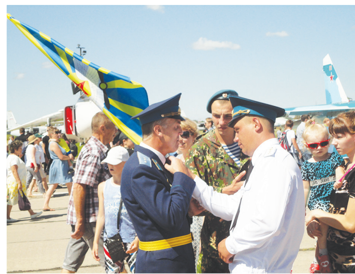
Последние приготовления перед торжественным построением.

Газета зарегистрирована в Управлении Федеральной службы по надзору в сфере связи, информационных технологий и массовых коммуникаций по ДФО.