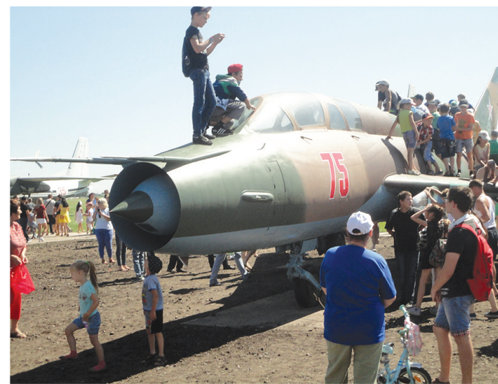
Авиатехника пользовалась у ребятишек большой популярностью.